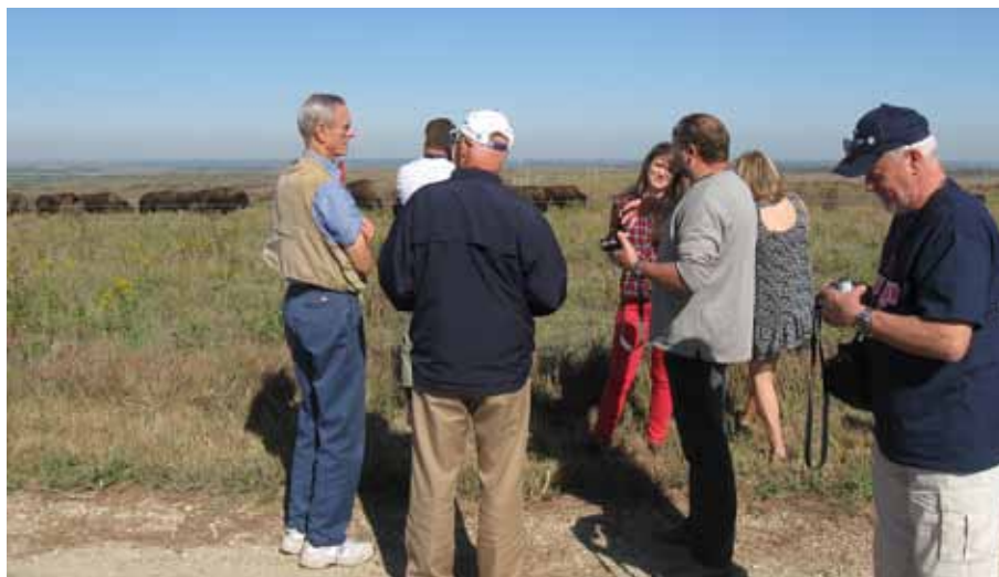
Vydali jsme do nedaleké rezervace, kde žijí bizoni