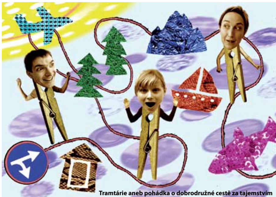
Tramtárie aneb pohádka o dobrodružné cestě za tajemstvím

Ve čtvrtek 12. ledna 2012 ve 20 hodin vystoupí v koncertním sále Základní umělecké školy Černošice kytarista, hudební pedagog a zakladatel mezinárodního hudebního festivalu „Kytara napříč žánry“ Stanislav Barek. Jednoho z nejlepších kytaristů, který navštívil se svým virtuózním uměním mnoho pódii po celém světě, můžeme