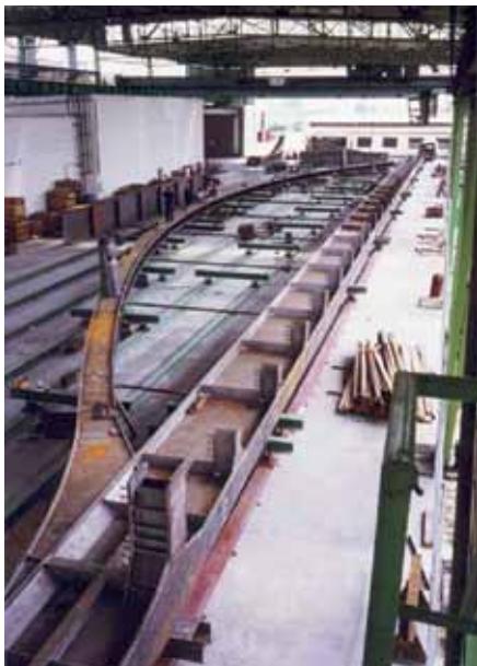
Nezvyklý pohled na jednu stranu oblouku v mostárně v Prostějově