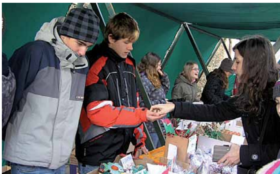
Žáci 8. třídy se ujali stánku školy na dětském vánočním jarmarku