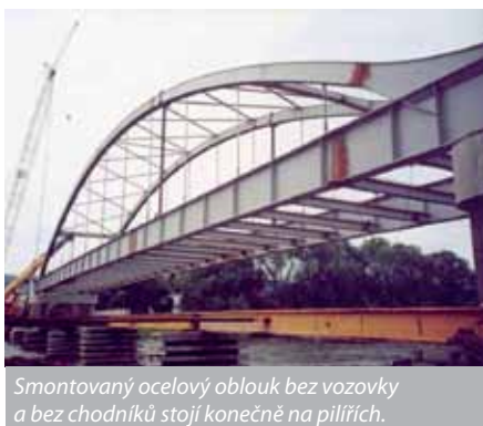
Smontovaný ocelový oblouk bez vozovky a bez chodníků stojí konečně na pilířích.

a v podstatě geniálním nápadem. Provést stavbu nového mostu jako rekonstrukci mostu starého, a to s využitím původních pilířů bez změny nivelety, ale s větší šířkou a s chodníky na obou stranách mostu. Toto řešení schválilo naše zastupitelstvo (i když tehdy jen nejtěsnější většinou osmi hlasů proti sedmi) se závazkem, že investorem stavby nebude stát, který od dobřichovického mostu dal ruce pryč, ale naše obec. Byla připravena naším nákladem projektová dokumentace (firmou Top Con srvis s.r.o.), která byla schválena jak Českými drahami, tak i Povodím Vltavy. Ve výběrovém řízení v lednu 1996 byl vybrán dodavatel stavby – firma Brex s.r.o. z Liberce, která most postavila v dohodnutím termínu bez jakéhokoliv navýšení dohodnuté ceny.