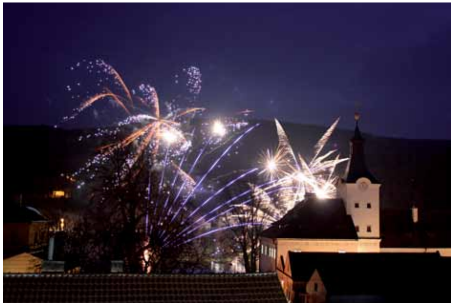
Letošní ohňostroj přilákal opět mnoho vděčných diváků

Kdo most financoval? Uvedli jsme již, že investorem stavby byla obec Dobřichovice. Cel-