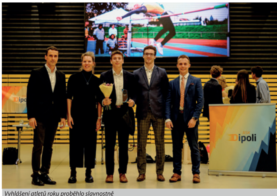
Vyhlášení atletů roku proběhlo slavnostně

s dvacetibodovým náskokem na prvním místě, takže o jejich postupu do skupiny finálové, kam z každé skupiny postoupí první tři, není pochyb.