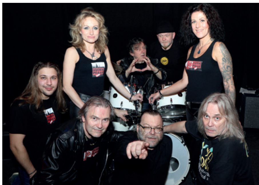
V Černošicích vystoupí Hudba Praha band