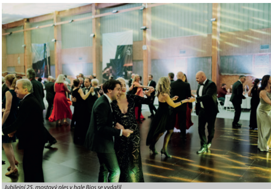
Jubilejní 25. mostový ples v hale Bios se vydařil