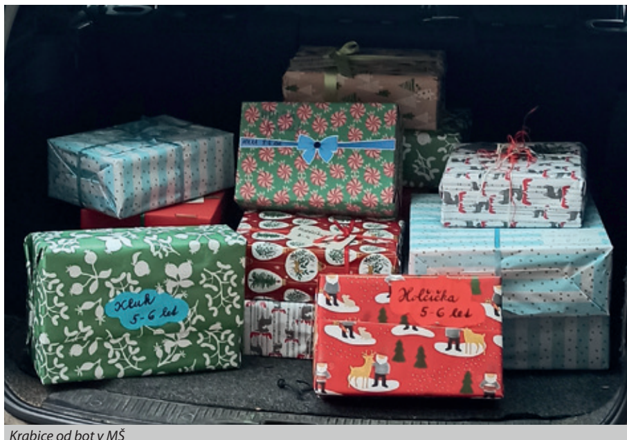
Krabice od bot v MŠ