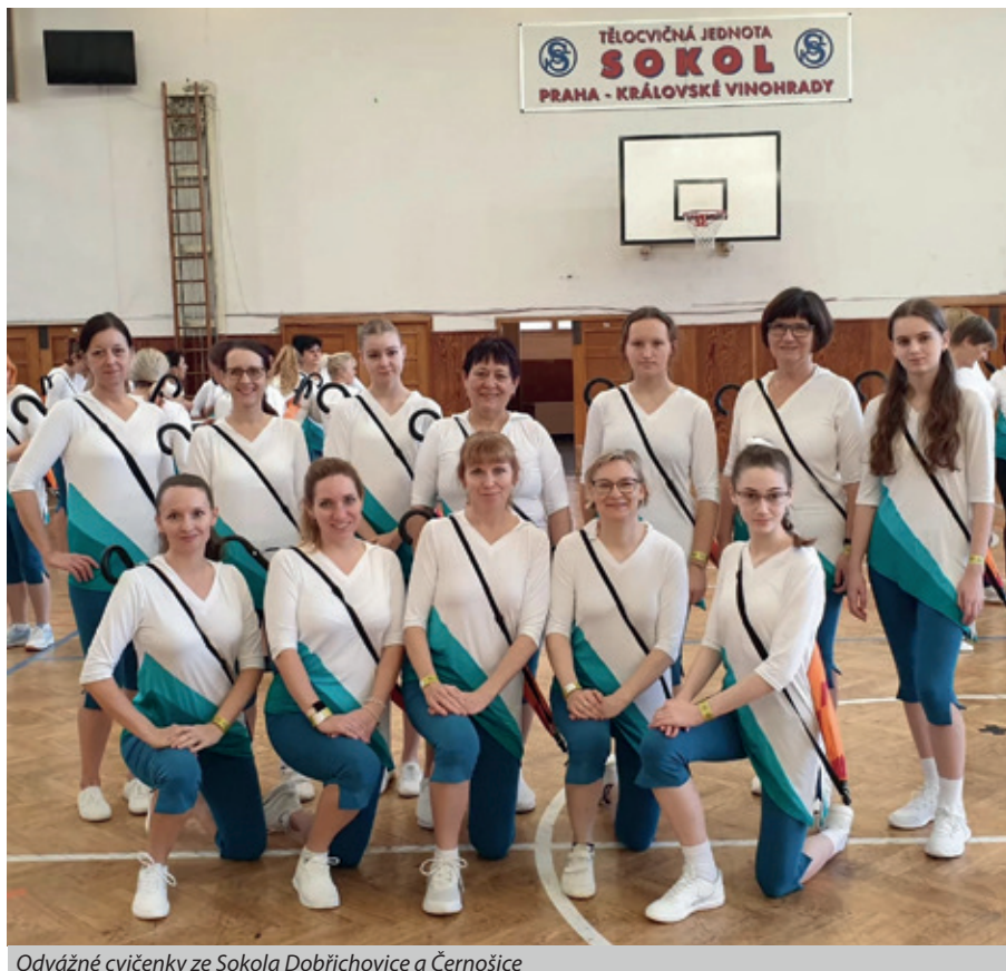
Odvážné cvičenky ze Sokola Dobřichovice a Černošice

Klidný adventní čas a radostné vánoce ve zdraví všem přeje