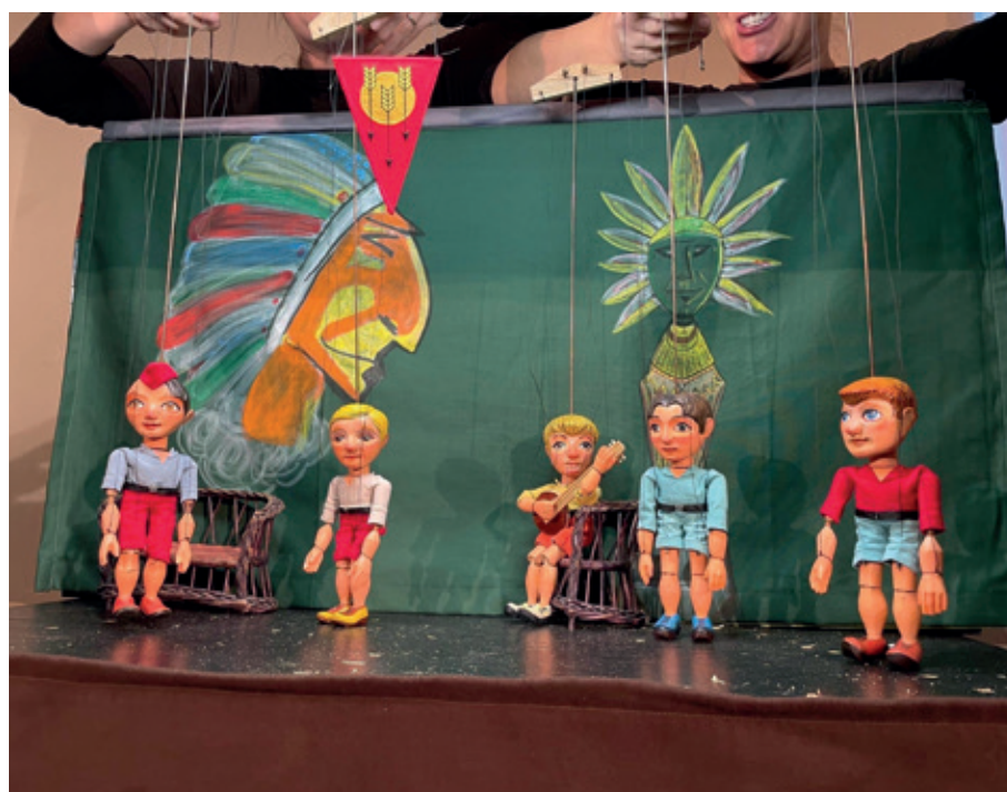
Rychlé šípy – v neděli 21. 1. od 16.00 v černošickém Club Kině

OTEVŘENO DOPOLEDNE : 10.00 – 12.00 - ODPOLEDNE 14.00 – 17.00