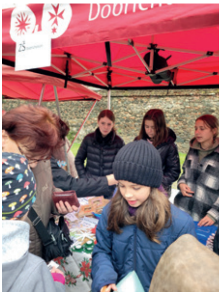
Stánek naší školy byl v obležení