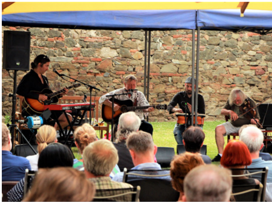
Koncert Vladimíra Mertvy na zámku dne 20. června