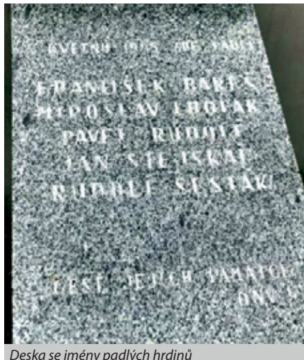
Deska se jmény padlých hrdinů

Dům se postupně splácel právě z nájemného, ale tehdy bylo nájemné spíš symbolické. V době, kdy jsem se vdala, pomáhali se splácením již moji bratři, kteří si již vydělávali. Dům se splatil až v roce 1968. Postupně se i bratři oženili a na domě se udělalo mnoho oprav a úprav a rodina se rozrůstala. Po roce 1993 bylo sice možné žádat o odškodnění pro vdovy a sirotky po válečných obětech, ovšem jen po těch, kteří zemřeli do data 5. 5. 1945, ale protože náš otec byl zastřelen až 8. 5. 1945 nebylo možné naši žádost tenkrát přijmout a vyhovět jí. Toho jsme se dočkali až v roce 2003, kdy prošla legislativní úprava a naše žádost o odškodnění byla podána