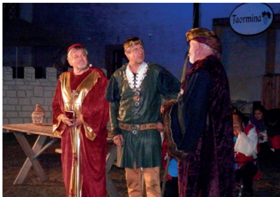
Noc na Karlštejně se odehraje v pátek 4. září od 20 hodin na nádvoří zámku v Dobřichovicích

Těšit se ale můžete i na ostřílené a mnoha rolemi prověřené ochotníky, z nichž nejeden je