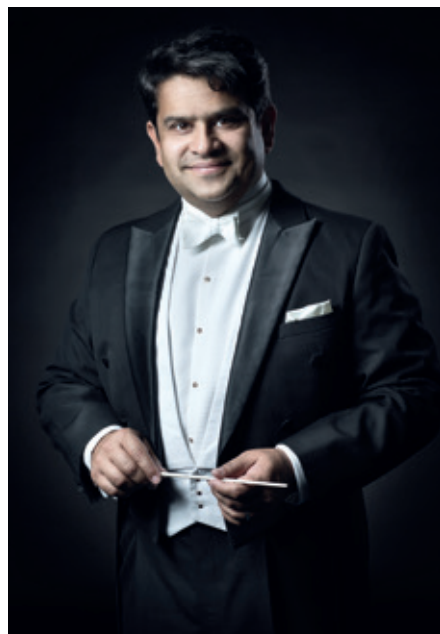
V Lesním divadle v Řevnicích zahraje filharmonický orchestr pod taktovkou indického dirigenta Debashish Chaudhuriho

22. srpna se můžete těšit opět na večer operních árií v podání Ester Pavlů. Tentokrát přizvala Terezu Mátlovou, o klavírní doprovod se jako vždy postará Ahmad Hedar. Začátek je v 19 hodin.