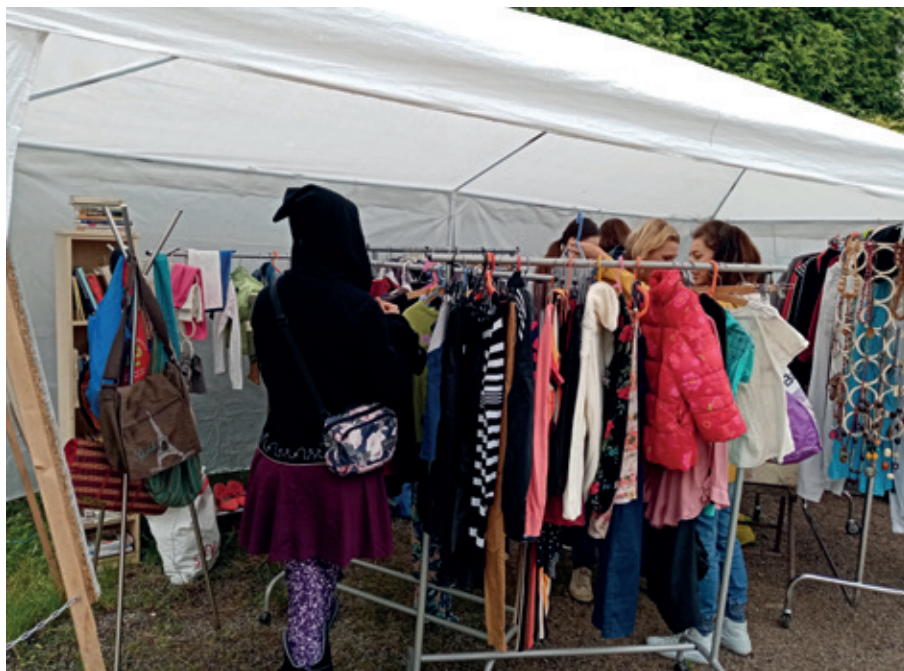
Na akci SWAP si zájemci mohli vyměňovat to, co nepotřebují, za něco jiného, co naopak potřebují

správně sedět ve školní lavici, proč nemám mít sešit našikmo a kroutit se v zádech.