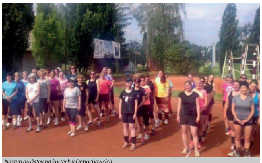
Nástup družstev na kurtech v Dobřichovicích

1. Dobřichovice 2. Komárov 3. Řepy 4. Řevnice 5. Oaza 6. Zlíchov