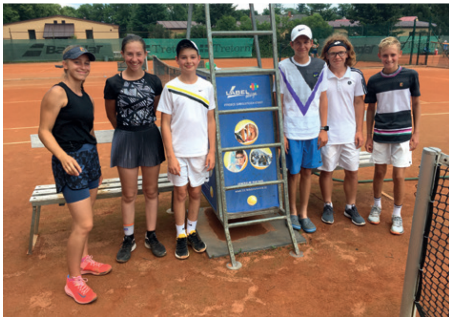
Postupový tým dorostenců týmu F. H. TK Dobřichovice

Turnaj se vydařil, všechna družstva přislíbila účast na jubilejním desátém ročníku.