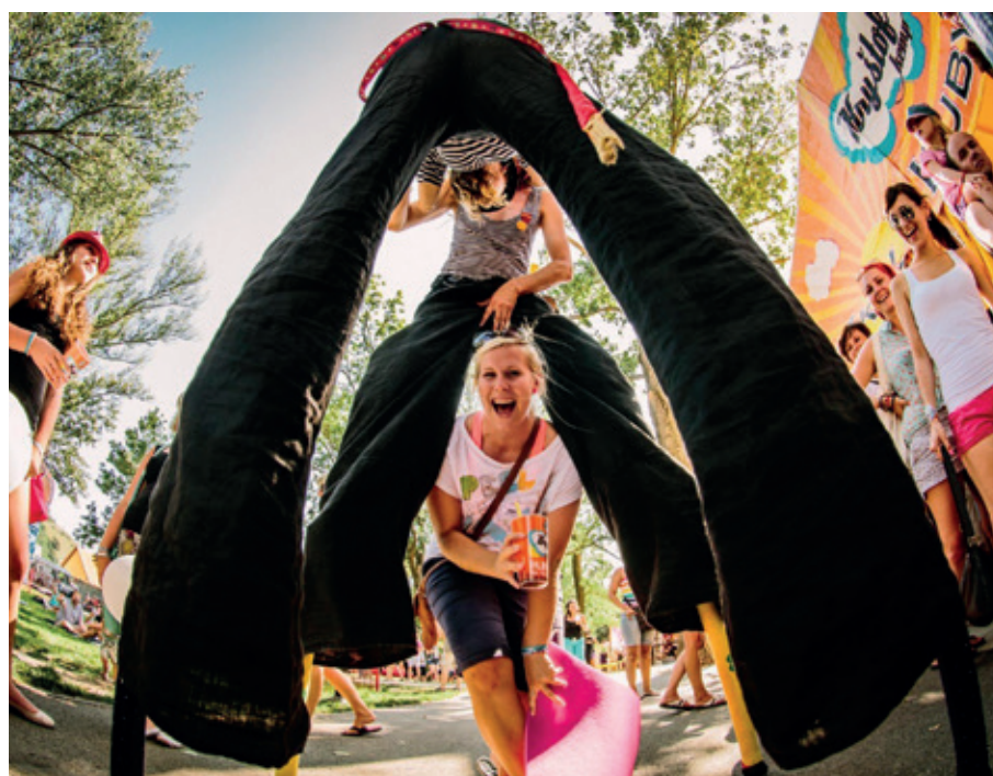
Černošická Mariánská pouť – Bajky divadla Studna