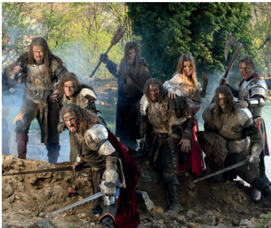
Černošická Mariánská pouť – Rytířský Turnaj – ŠHC Burdýři