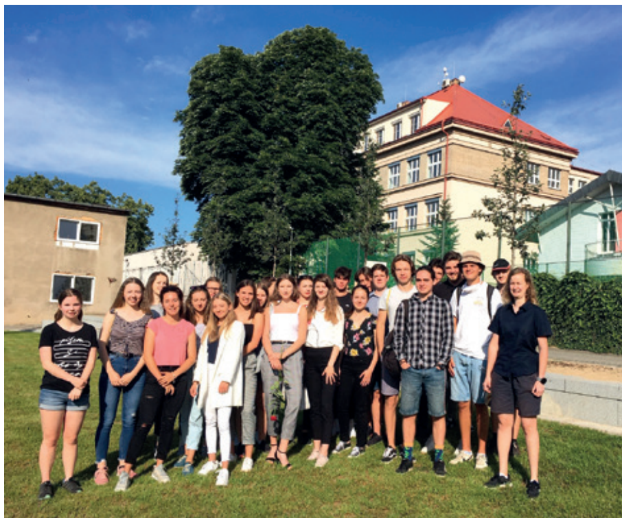
Jedna třída Gymnázia Radotín se raduje na konci školního roku