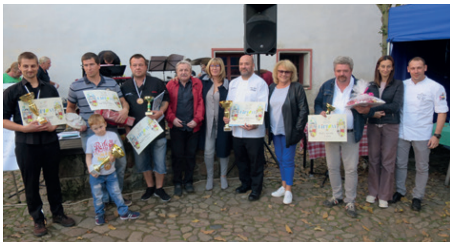
Vítězové s oceněními a s členy poroty v roce 2018

V říjnu uplynou dva roky od posledního ročníku Festivalu svíčkové omáčky. Ročník 2018 byl poznamenán nižším zájmem soutěžících kuchařek a kuchařů, který mě nakonec donutil uvařit opět i svůj vlastní vzorek, nakonec označený za nesoutěžní. Tehdy jsme se rozhodli změnit roční periodu a z festivalu udělat bienále. Jenomže čas plyne rychleji než voda, dva roky jsou skoro ty tam a protože chceme dodržet své slovo, vyhledáváme za Agenturu GEI-ŠA další, již šestý ročník Festivalu svíčkové omáčky – Memoriálu Jenufa Šuchmy. Pokud situace dovolí, měl by se uskutečnit ve standardním termínu počátkem října a navázat