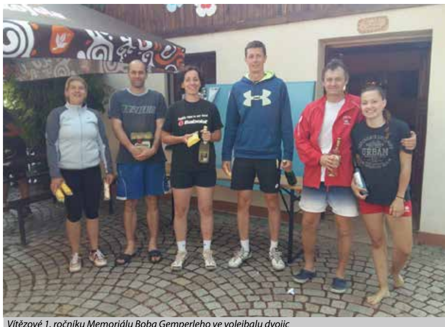
Vítězové 1. ročníku Memoriálu Boba Gemperleho ve volejbalu dvojic