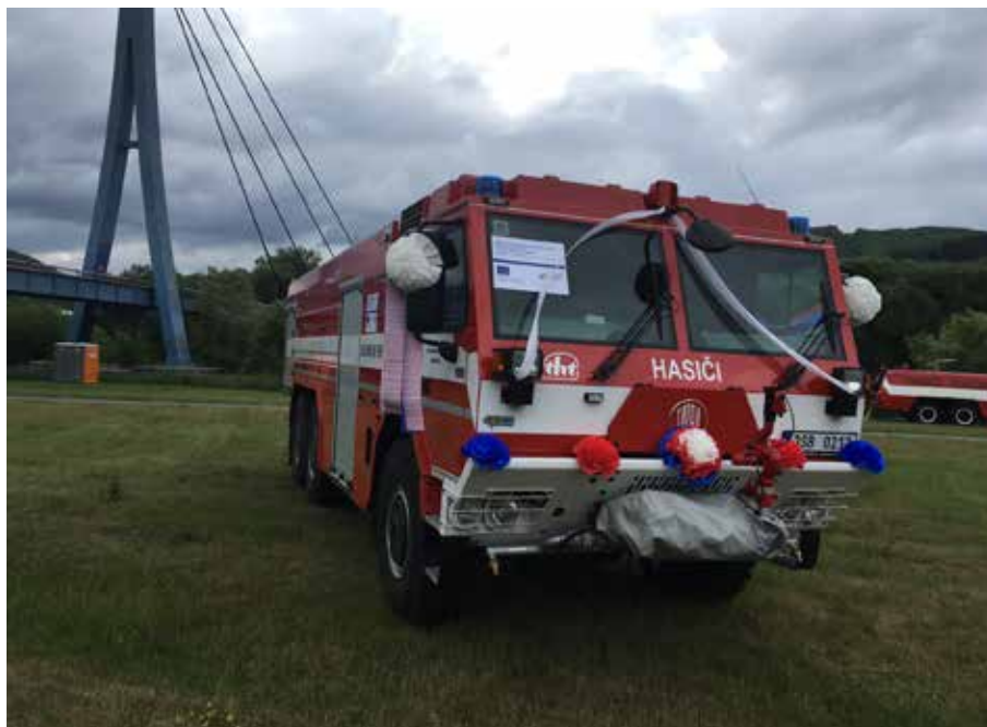
Nová cisterna byla slavnostně přivítána

Základ poplatku za ukládání využitelného odpadu na skládku v roce 2017 činí 500 Kč/tuna, přičemž do roku 2024 se pravděpodobně vyšplhá až na hodnotu 2 000 Kč/tuna. To se negativně promítne do rozpočtů obcí a měst, které budou muset chybějící peníze někde vybrat. Navyšování poplatku za odpady není určitě nic příjemného. Naštěstí se dá před budoucím zdražováním bránit poctivějším tříděním odpadů. Jak je to možné?