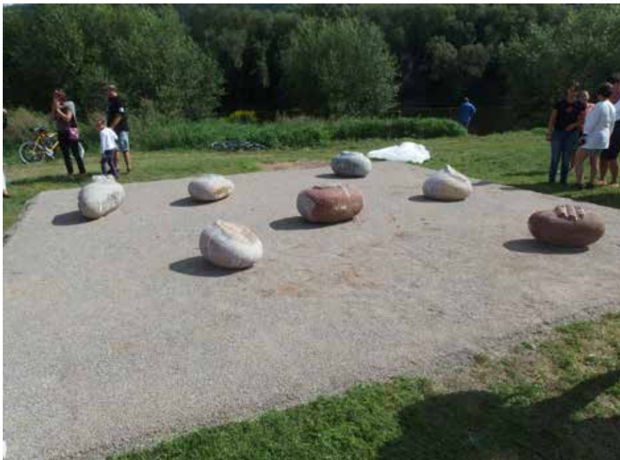
Zahrada – dílo Hiromi Nakagawa-ové