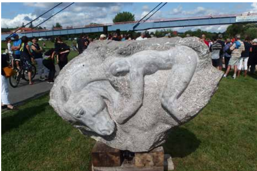
Dívka s koněm – dílo Petra Nováková