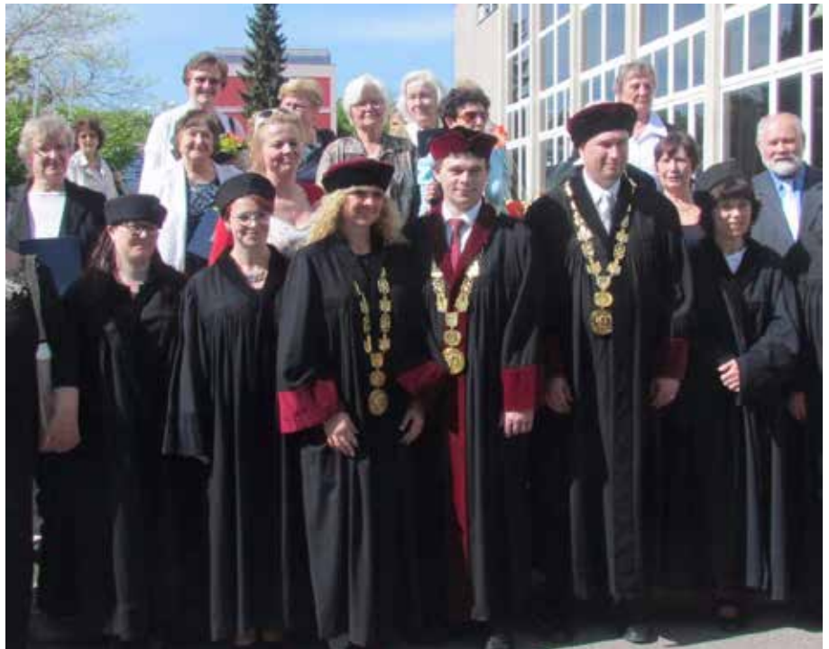
Promoce účastníků univerzitního studia 3. věku

Zahrádkáři, skauti, včelaři, školka, družina–ti všichni se budou podílet na programu posvícenského odpoledne. Knihovna Všenory organizuje