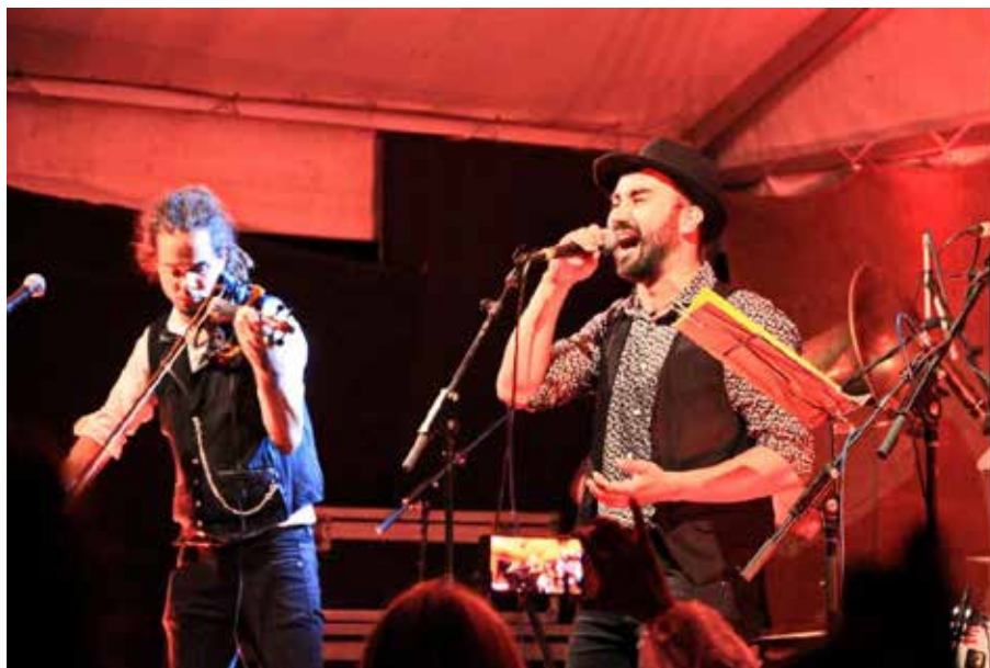
Dne 24. července vystoupila na zámku kapela Circus brothers

Koncert známého písničkáře předprodej v Infocentru 150,- na místě 200,-