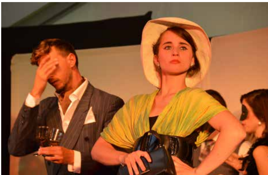
Kočovné divadlo Ad Hoc k nám přijelo s představením Il Cogelatore s mnoha známými melodiemi