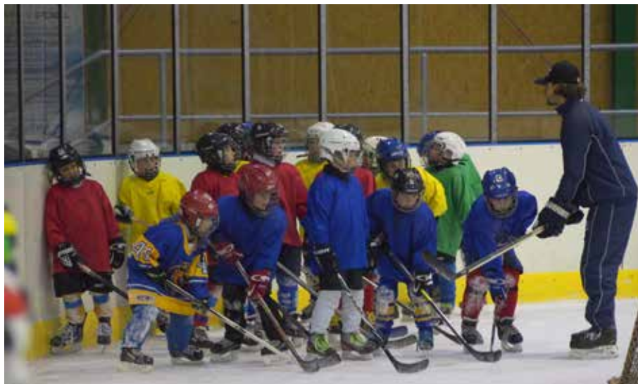
I ti nejmenší jsou v plné hokejové výstroji

Stále se snažíme zlepšovat podmínky pro všechny, kdo se na zimním stadionu pohybují.