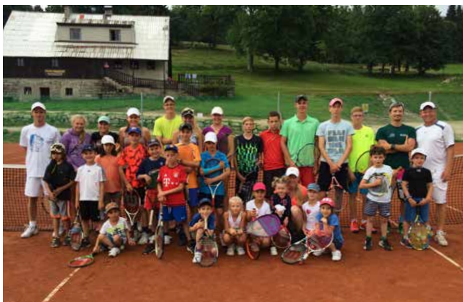
Soustředění tenistů TK Dobřichovice