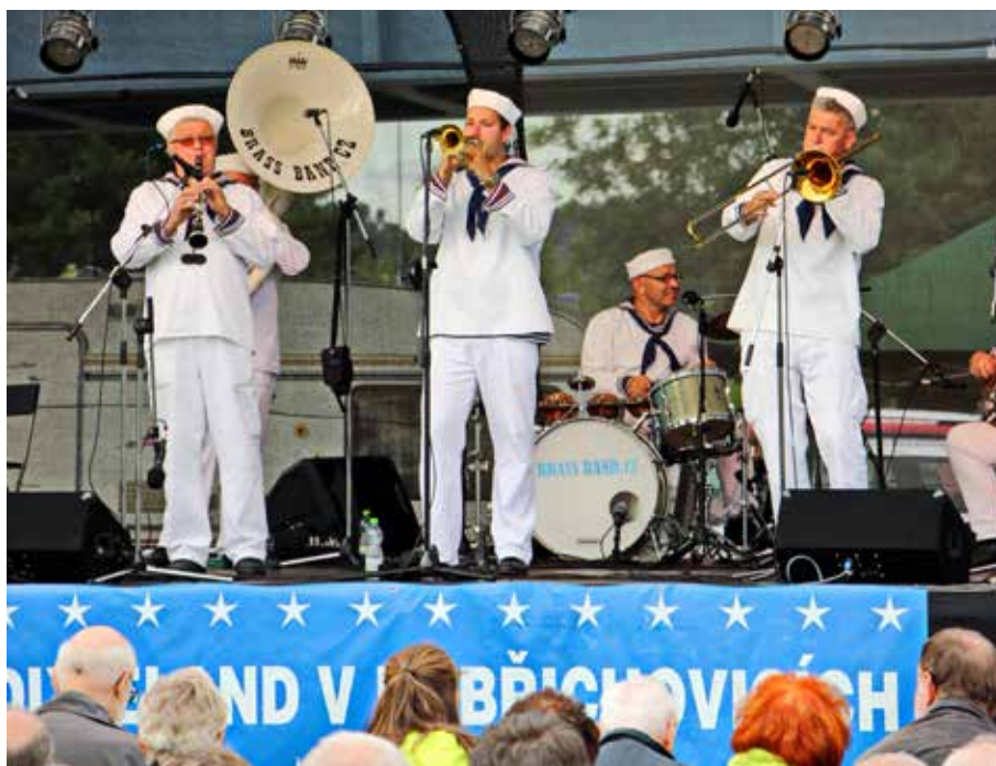
Výborně se vydařil dixielandový festival. Na podium je Brass Band Rakovník.