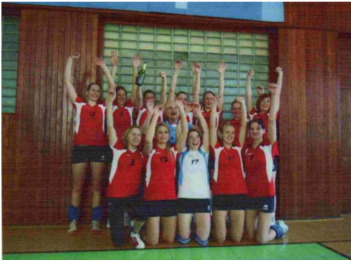
Radost družstva žen Sokola Dobřichovice po vítězství v jednom z rozhodujících ligových zápasů.