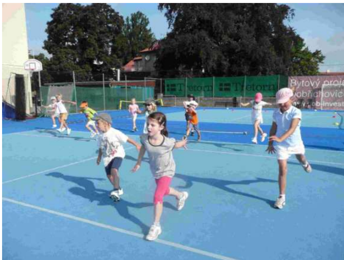
Foto z loňského tenisového kempu ve Sportclubu Řevnice