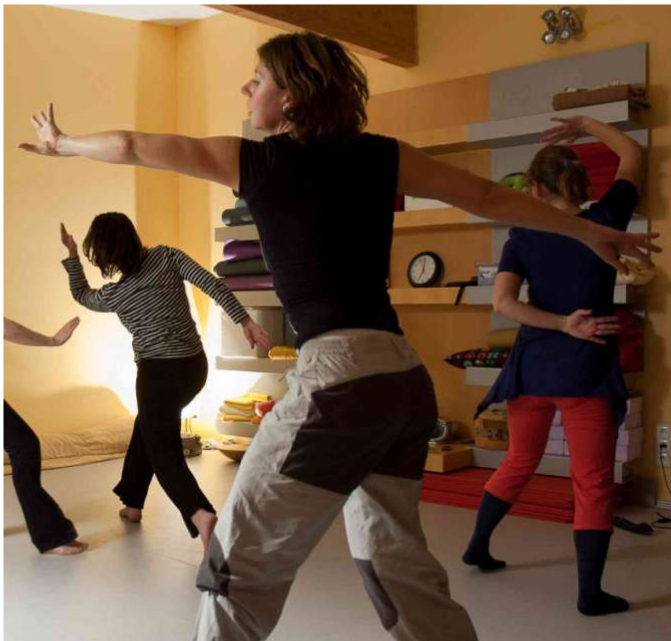
Taneční dílna v CKP Dobřichovice