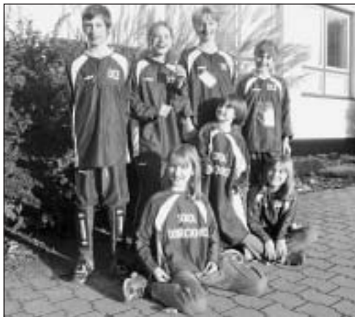
V Mělníku před odjezdem na třetí etapu do Kokořínských skal