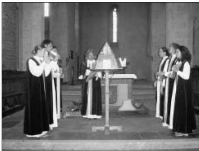
Ludus musicus při koncertu v Perouges.