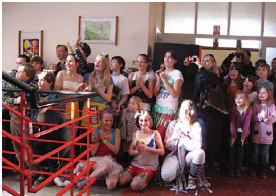
V naší škole se konal Den otevřených dveří