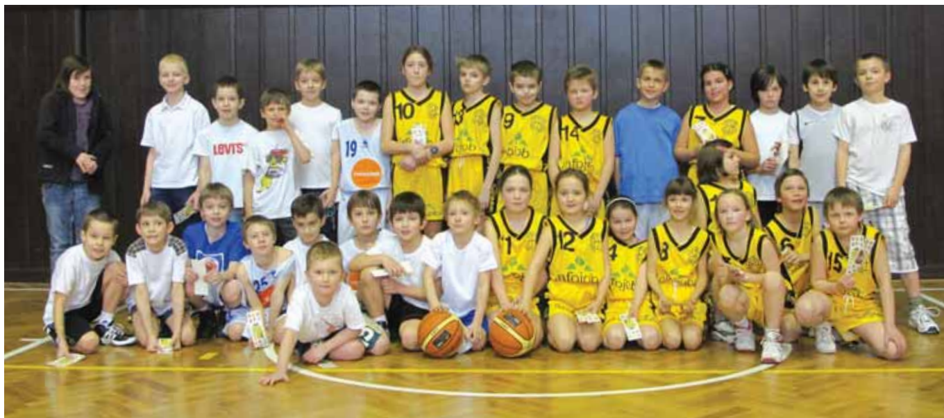
Basketbalová družstva Kámoklubu (ve žlutém) a Sokola pražského (v bílém)