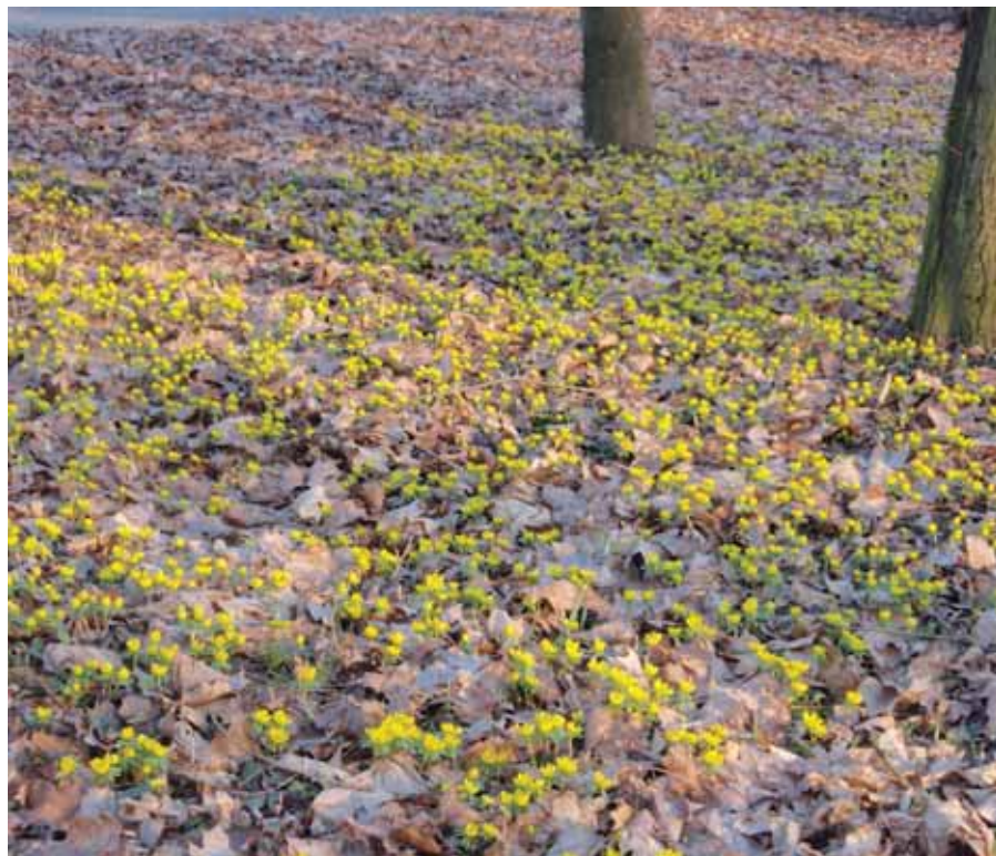
Dobřichovický park vykvetl již v polovině února žlutými talovými zimními a kvete tak ještě i na konci března