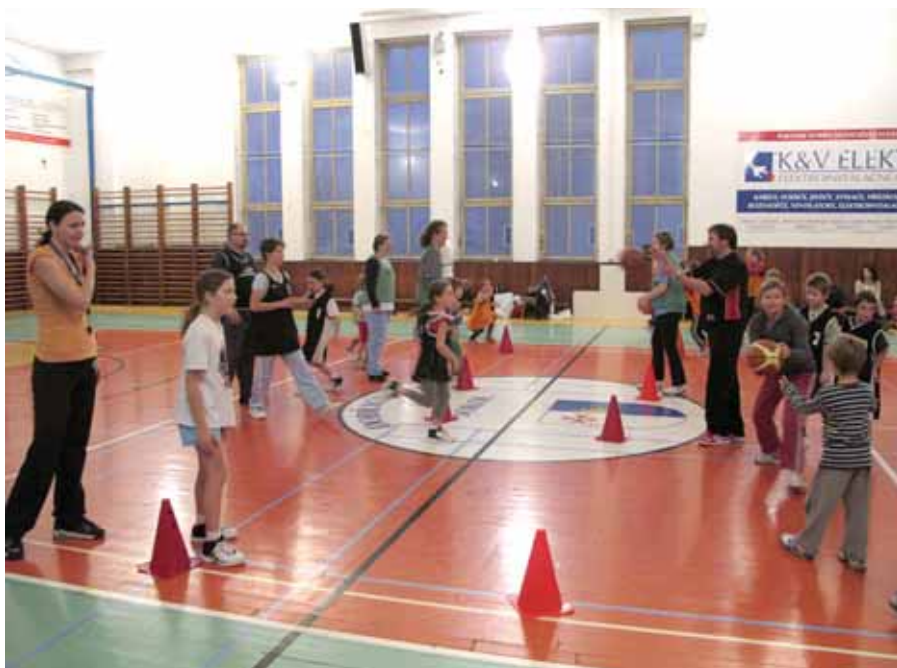
Kámoklub v Sokolovně