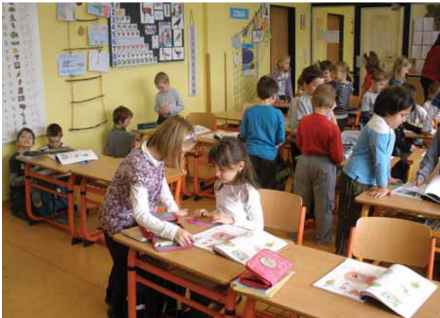
Předškoláci poprvé ve škole

Vzhledem k očekávanému značnému poškození velké části ploch, přistoupí možná vedení Sokola i k dalším zemním úpravám, které by měly být v souladu s právě vznikajícím „Plánem rozvoje areálu“ a jejichž cílem by mělo být pretvarování stávajících valů u fotbalového hřiště do nové podoby. Přestože areál je vlastnictvím Sokola, počítá se i nadále s jeho vyu-