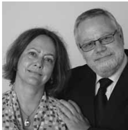
Romeo a Julie po 40 letech