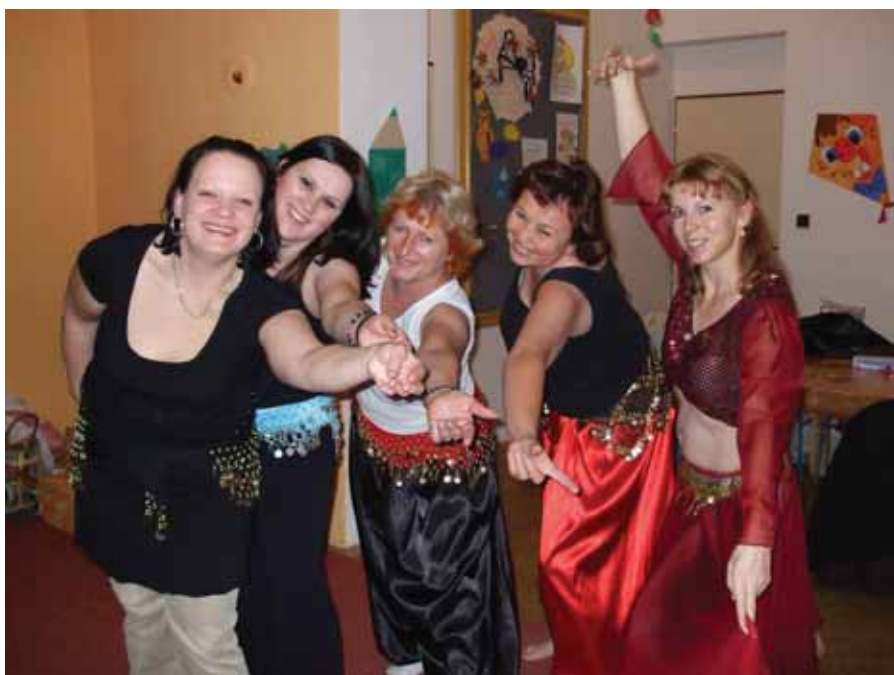
Dobřichovické břišní tanečnice