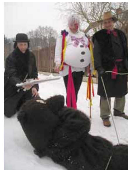
Tradiční postavy zadnotřebského masopustu – medvěd s medvědářem, Masopust-Pro-nobus a Žid.