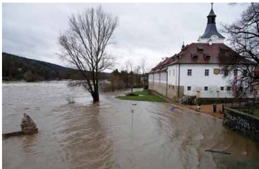
V pátek 14. ledna v poledne byla voda u paty dobřichovického zámku.

Mnohaměsíční úsilí vedení TJ Sokol Dobřichovice o získání výraznějších finančních prostředků prostřednictvím grantů a dotací bylo v závěru minulého roku korunováno kýženým úspěchem. Místní tělovýchovná jednota uspěla se svým projektem „Revitalizace ve-