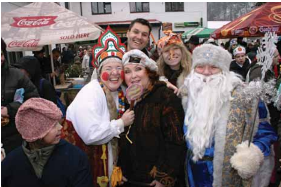
Oslav masopustu v Zadní Třebani už se v jejich více než dvacetileté historii zúčastnil leckdo – třeba Mrazík s Marfušou či Nada Konvalinková.