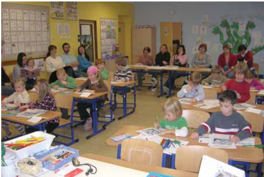
Děti ve škole nanečisto