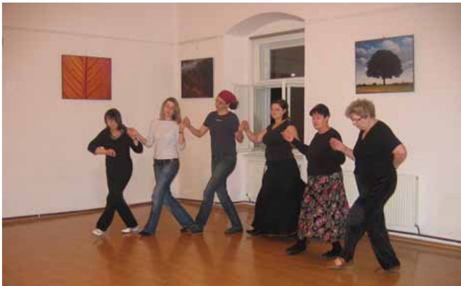
Výuka řeckých tanců