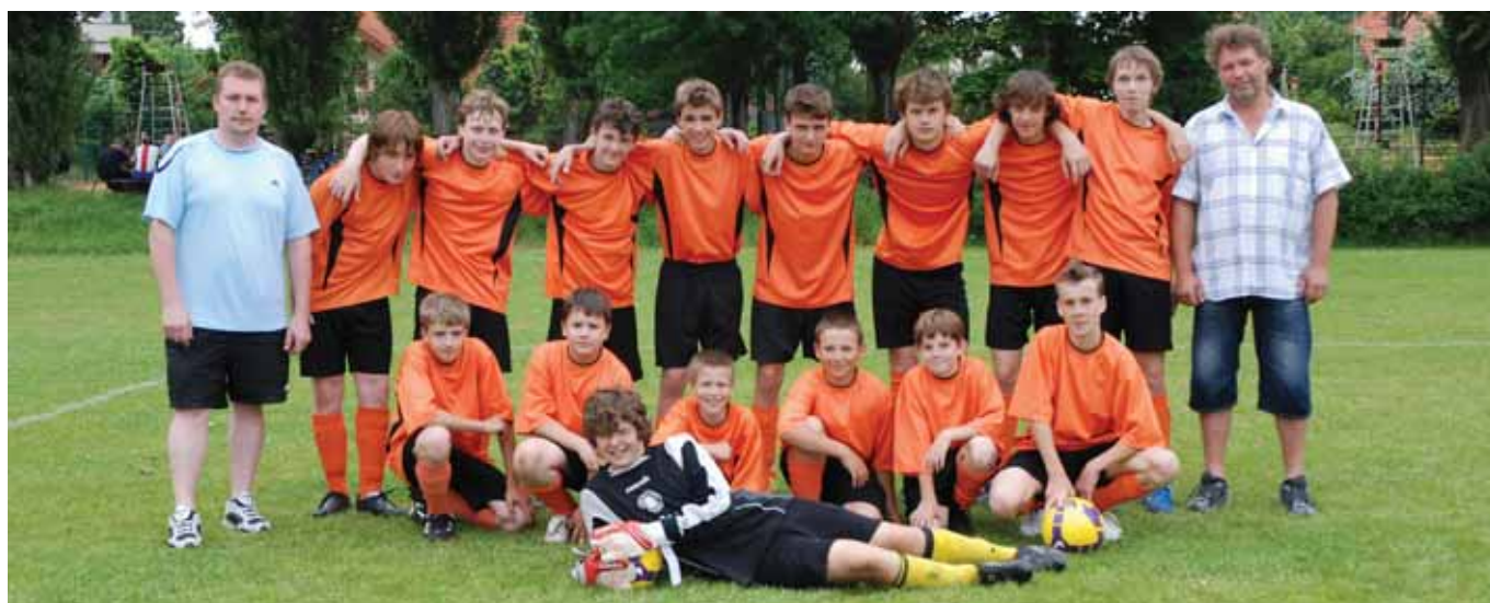
Dobřichovické družstvo starších žáků vyhrálo okresní přebor

1. Vestecká sportovní : Sokol Dobřichovice A 9:0 Tennis Dobříš B : Sokol Dobřichovice A 2:7 Sokol Dobřichovice A : TK Březnice B 6:3 LTC Řevnice : Sokol Dobřichovice A 4:5 Sokol Dobřichovice B : Sokol Sedlčany B 2:7 Sokol Dobřichovice B : Tennis Dobříš C 1:8