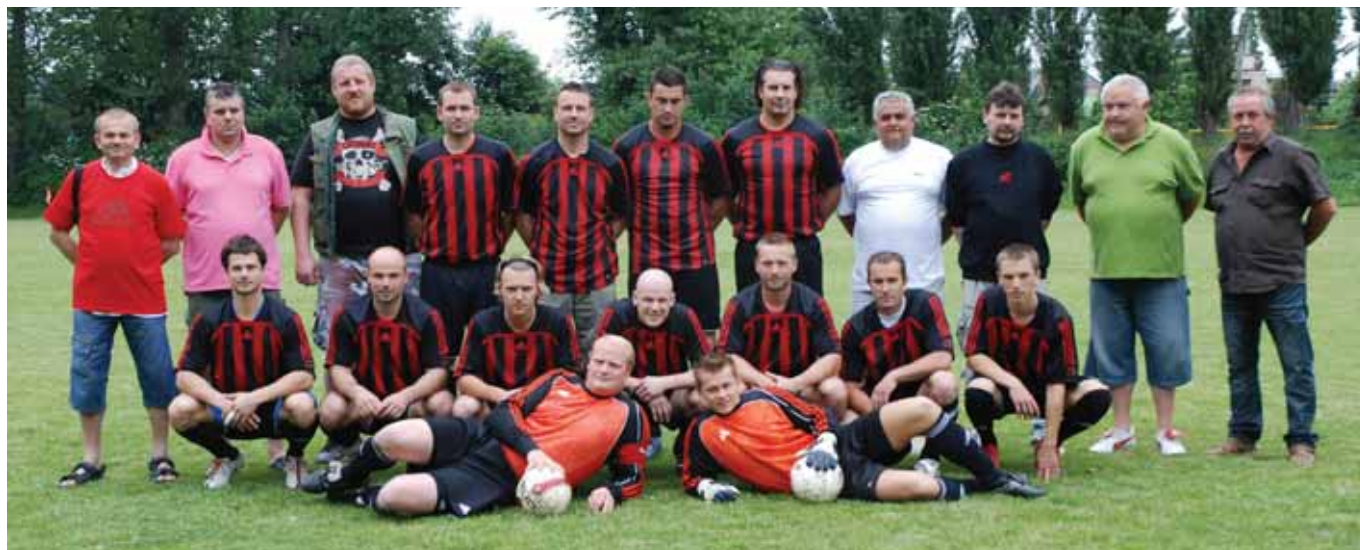
Dobřichovické A mužstvo postoupilo do 1A třídy Středočeského kraje