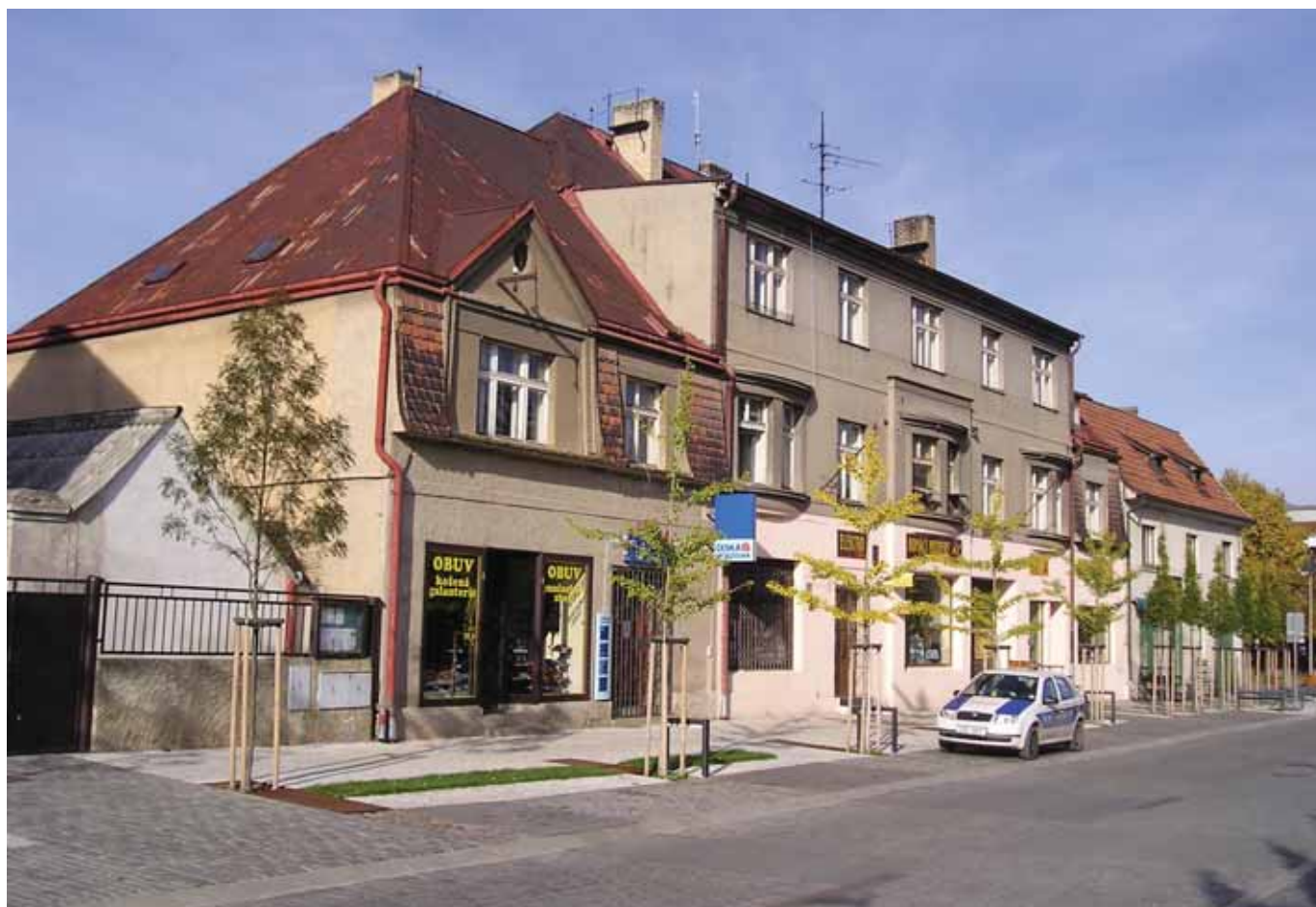
V centru vyrůstá nový dům na místě tří starých domů.