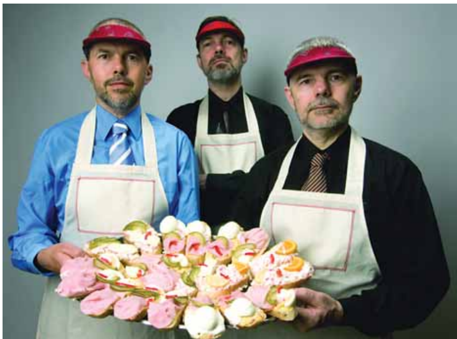
Bratři Ebenové vystoupí v Černošicích

Vydejte se s na cestu do oblak v domě přivázaném na spoustu balónků v jednom z nejhezčích dětských filmů poslední doby.