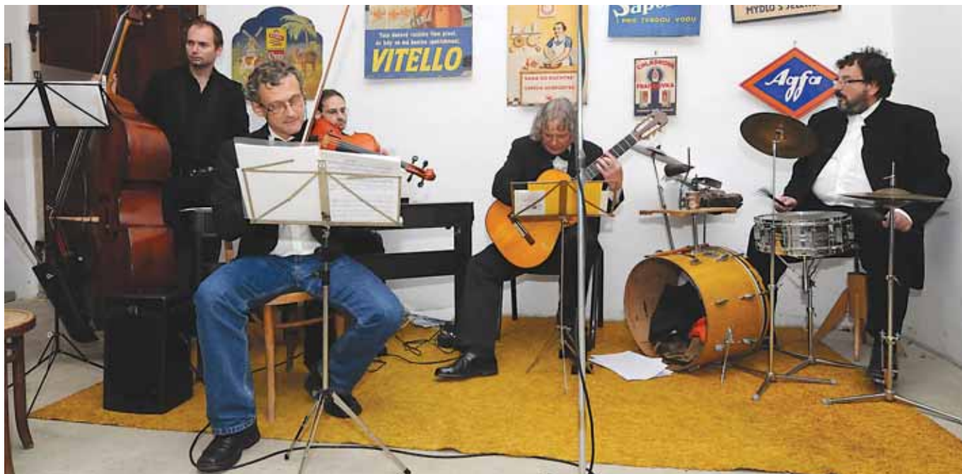
Swingová skupina Tuxedo Orchestra