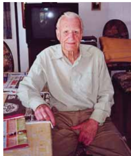
Praha, 10. října s MFF Praha, 30. října s Českými Budějovicemi, 31. října s Brnem B, 20. 11. s Odolnou Vodou a 21.11. s Chomutovem. Pozvání na všechna uvedená utkání od všech hráček i hráčů vyřizuje HgS.