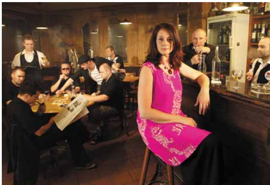
STO ZVÍŘAT – Postelové turné