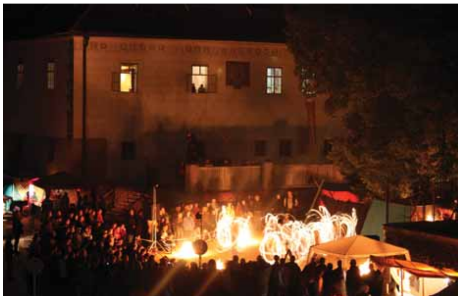
Vyvrcholením šermířského festivalu byla ohňová show