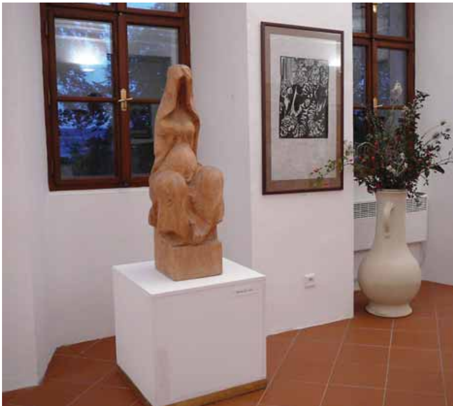
Expozice soch Milana Váchy a grafiky Jiřího Altmanna v klášteře na Skalce

Sobota 10. října, 15.00 – areál kláštera na Skalce. ÚTĚK NA MAURICIUS – vernisáž