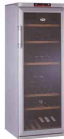
Takto vypadala ukradená vinotéka