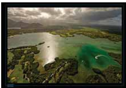
Jedna z vystavovaných foto z ostrova Mauricius