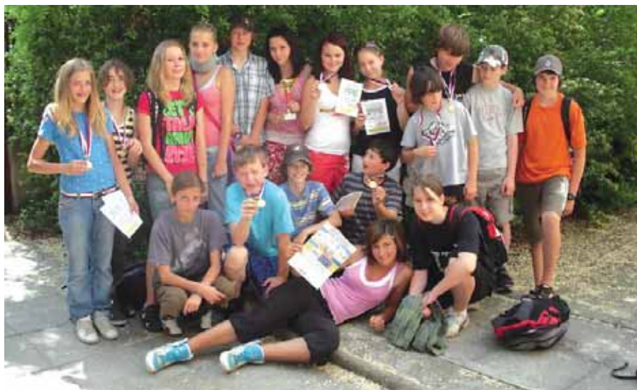
Družstvo mladších žáků a žákyň