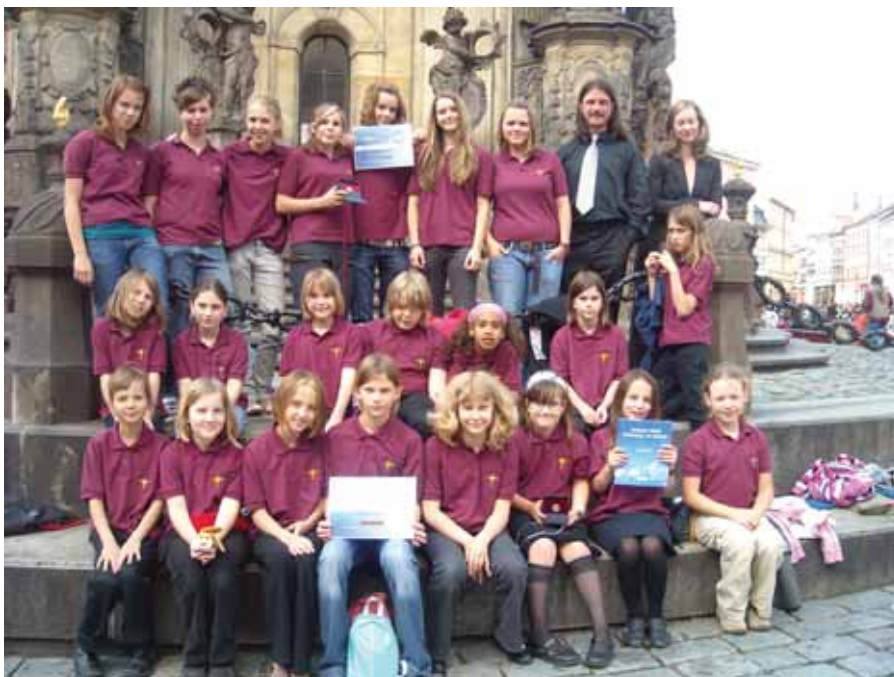
Chorus Angelus nao festivalu Svátky písní Olomouc

Vydejte se na samý počátek ságy o lidech obdařených zvláštními schopnostmi neboli X-menech a odhalte tajemný původ jednoho z nich, odvážného Wolwerina. Režie: G. Hood. Hrají: Hugh Jackman, L.Schreiber a další