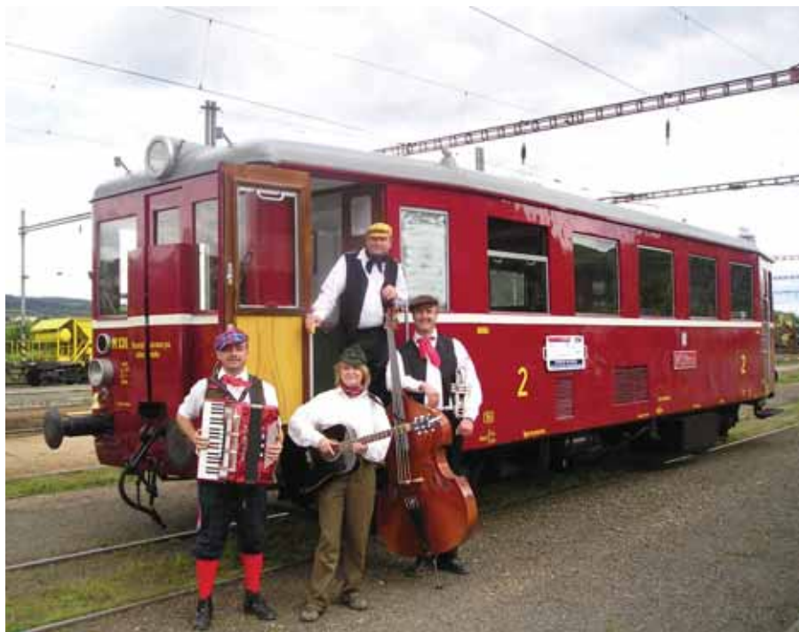
Při zahájení provozu Hurvínka zahrála a zazpívala i skupina Třehusk.

K lomu se pohodlně dostanete autem či na kole Karlickým údolím, v Kuchaři odbočte doprava směr Choteč, za Kuchaříkem pak jedte doprava po úzké asfaltce asi 800 m až k lomu. Poblíž nevedou žádné značené turistické cesty. Kdysi mě sem přivedlo posuzování žádosti našeho spoluobčana, který zde chtěl zřídit průmyslové drcení a recyklaci stavební sutě – z hlediska hlučnosti a prašnosti by snad umístění vyhovělo, ale je to uvnitř CHKO Český Kras – proto nebylo možno tento záměr povolit. Jiný podnikatelský záměr byl zavést celý lom výkopovou zeminou z Prahy a dotvarovat vrch do předpokládaného původního terénu. Ale raději ať lom zůstane tak jak to je – nakonec to posuďte sami.