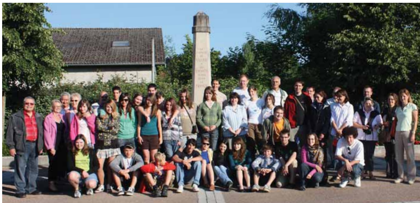
Na přelomu května a června jsme navštívili naši partnerskou francouzskou obec Villieu Loyes Mollon

K nám dojel císař Karel IV. se svojí poslední manželkou Eliškou Pomohánskou v sobotu 6.