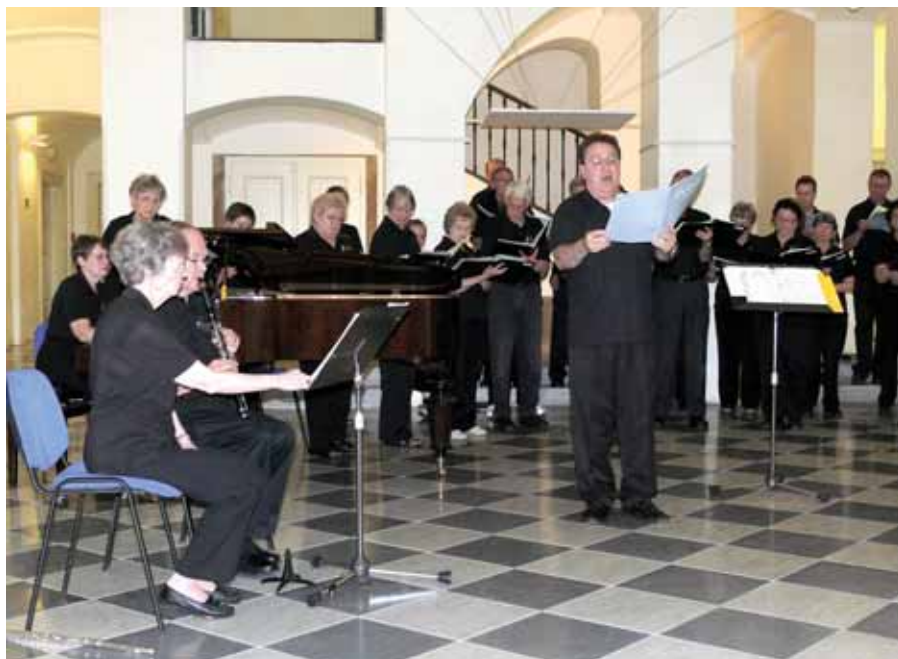
Smíšený pěvecký sbor „Flint Hills Masterworks Chorale“ v Českém muzeu hudby na Malé Straně

Ve dnech 5. a 6. června proběhly v celé Evropské unii a tedy i u nás již druhé volby do Evropského parlamentu. Souhrnné výsledky