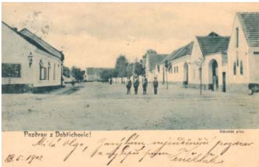
Ulice 5. května (tehdy Královská) v roce 1902