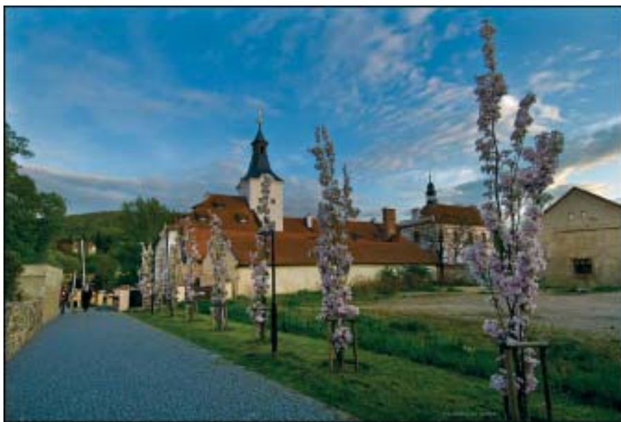
Nový pěší chodník k zámku byl letos lemován kvetoucími prunusy ( Prunus Serrulata Amano-gawa ).

Unikátní divadelní představení bude v pátek 6. června opět k vidění v areálu dobřichovického zámku. V původním muzikálu „Noc na Karlštejně“ si s řevnickými ochotníky zahrají i „hvězdy“, které jsou doma v kraji kolem Berounky – Vladimír Čech, Pavel Vítek a Jan Rosák. Ve speciálním sboru manů složeném ze starostů několika poberounských obcí bude