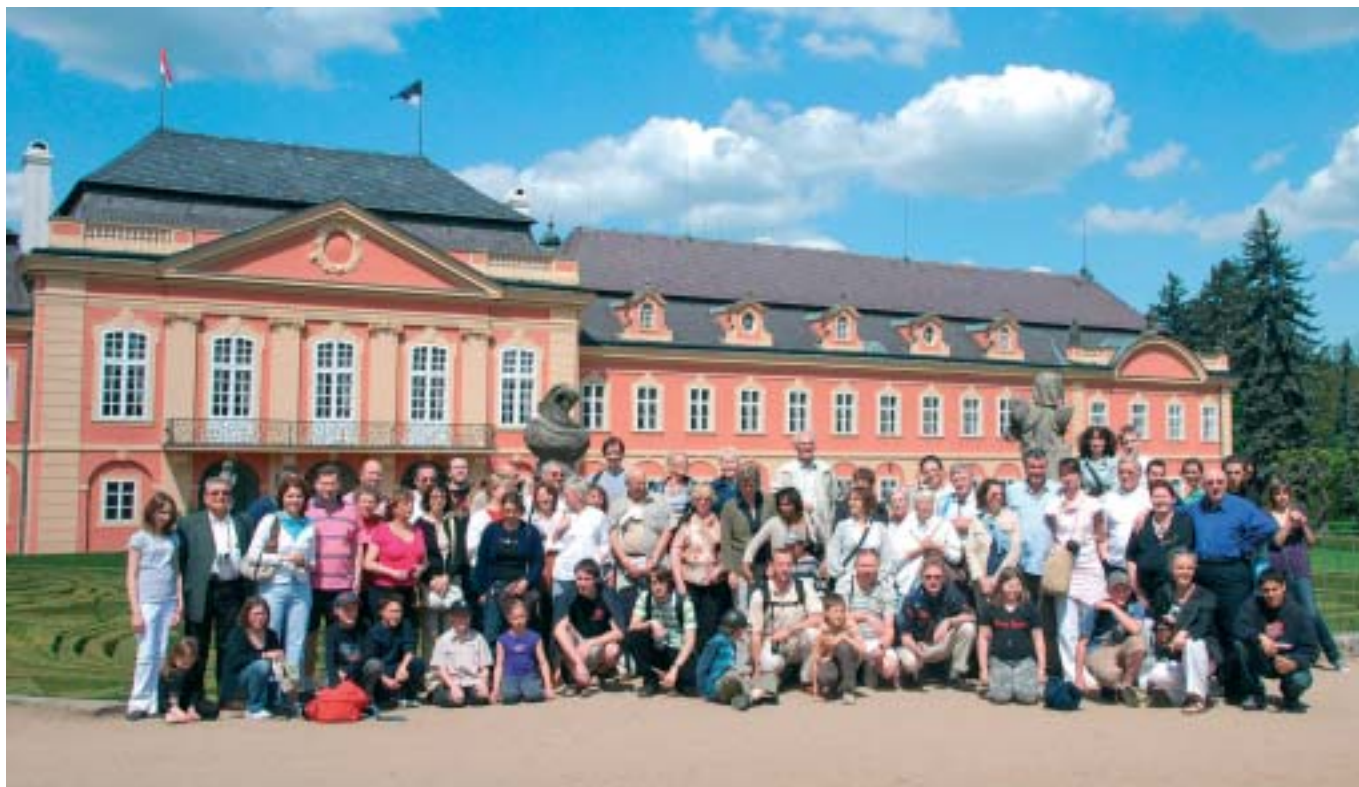
Francouzští hosté a jejich čeští partneři na zámku Colloredo-Mansfeldů v Dobříši