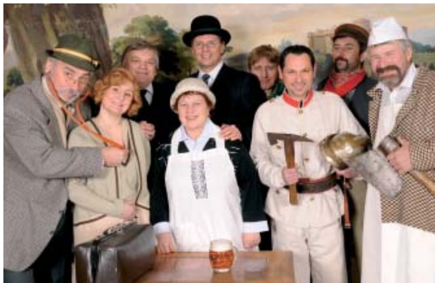
Postřiziny si zahrají profesionálové, amatéři, starostové, hejtmán i senátor