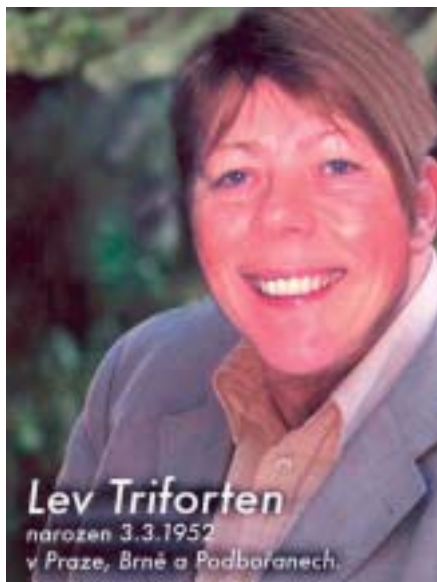
Autor hry Antonie a divoká karta