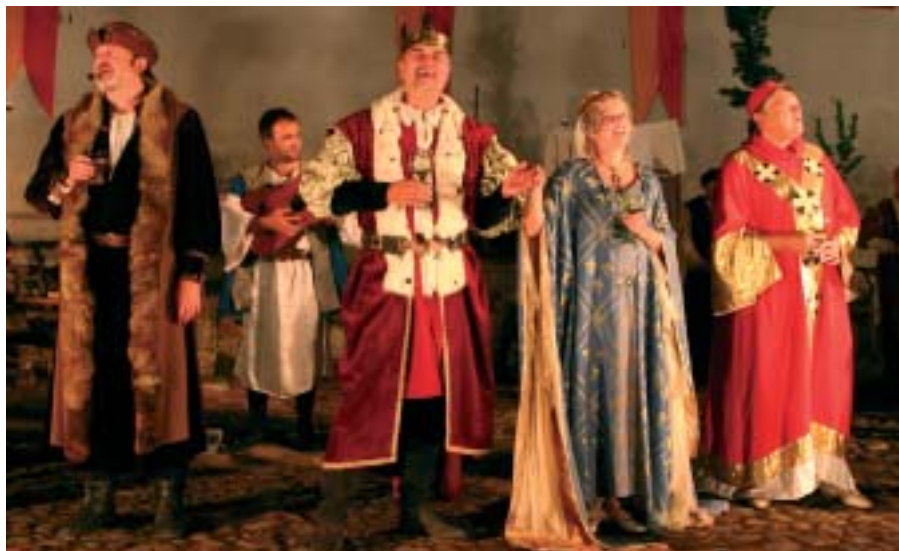
Noc na Karlštejně můžete vidět 6. června 2008, cca 22.00 na nádvoří zámku (viz strana 2)

ged“ koncert tváří v tvář pozorně poslouchajícímu publiku náročnější než běžné klubové nebo festivalové vystoupení, muzikanti se musejí obecně vydat doslova do poslední nitky a často sáhnout až na dno svých psychických sil. Při příležitosti unplugged turné zařadí skupina do repertoáru kromě největších hitů a pověstných improvizací i své starší skladby, které již dlouho na koncertech nehrála nebo ještě nikdy veřejně nevedla. Za deset let své existence se Minuty etablovaly na české scéně populární hudby jako jeden z nejvýznačnějších a kritiky nejuznávanějších formací. V roce 1999 získaly ocenění Akademie populární hudby „Anděl“ v kategorii „Objev roku“, v roce 2002 bylo jejich album „Home?“ nominováno v kategorii „Album roku“. Dalším oceněním je nominace „Nejllepší zvuk“ za nahrávku alba „Mom“ (Universal Music, 2005). Vstupenky je možno zakoupit v předprodeji v trafice u Václavků na černošickém nádraží. Vstupné v předprodeji 140 Kč na místě 150 Kč.