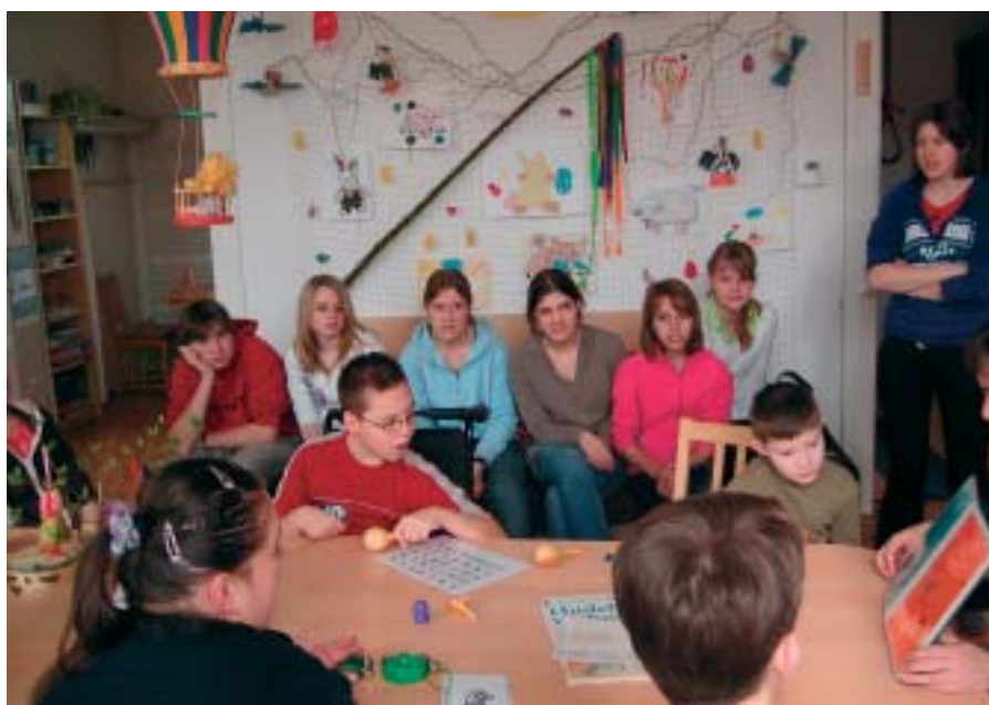
Žáci devátých tříd dobřichovické školy na návštěvě stacionáře Náruč

Největší překvapení mě ještě čekalo. Než jsem se s nimi po přednášce rozloučila, požádala jsem je, jestli by pro náš stacionář nevy-