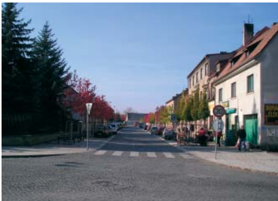
Ulice 5. května v roce 2005

původní domy připomíná dnes již jen rohový objekt čp. 10 rodiny Fürstovy. Byl např. zbouřena uliční část statku čp. 13, kde je dnes hasičská zbrojnice.