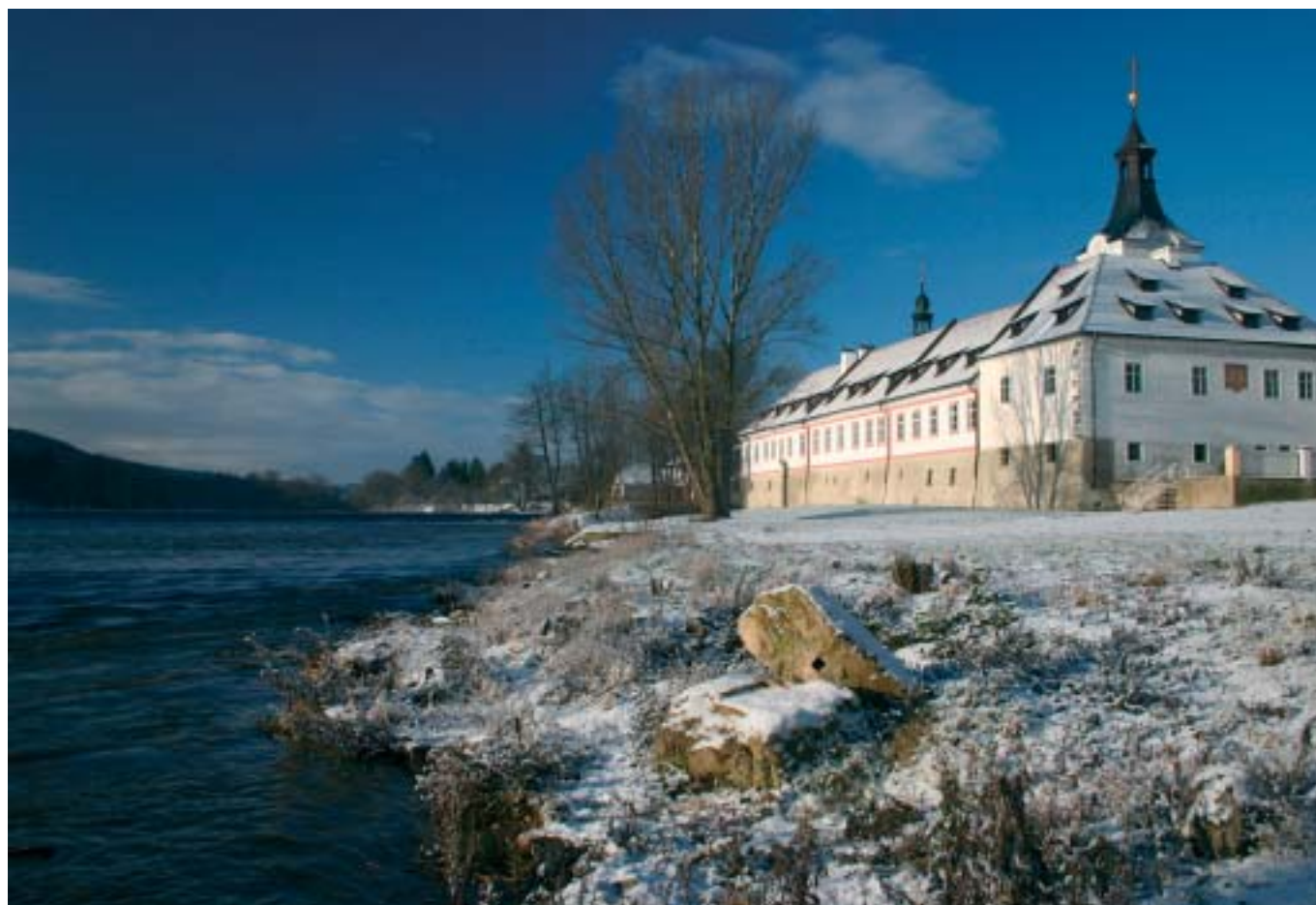
Dobřichovický zámek v zimě. Jedna z fotografií, kterou naleznete v kalendáři Romana Garby.

První vlak (resp. poslední večerní) odjíždí z hlavního nádraží v 0:26 hod. (ze Smíchova v 0:34). Další pak jede ve 4:21 hod. a potom