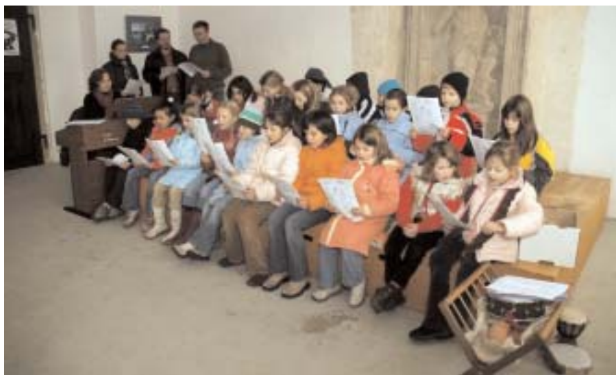
Děti základní školy zpívají koledy během vánočních trhů na zámku dne 16. prosince.

Miranda, nejmocnější žena módního průmyslu dusí coby šéfredaktorka časopisu mladičkou a v oboru nepřilíší zběhlou absolventku žurnalistiky. V hlavních rolích satirické komedie Me-