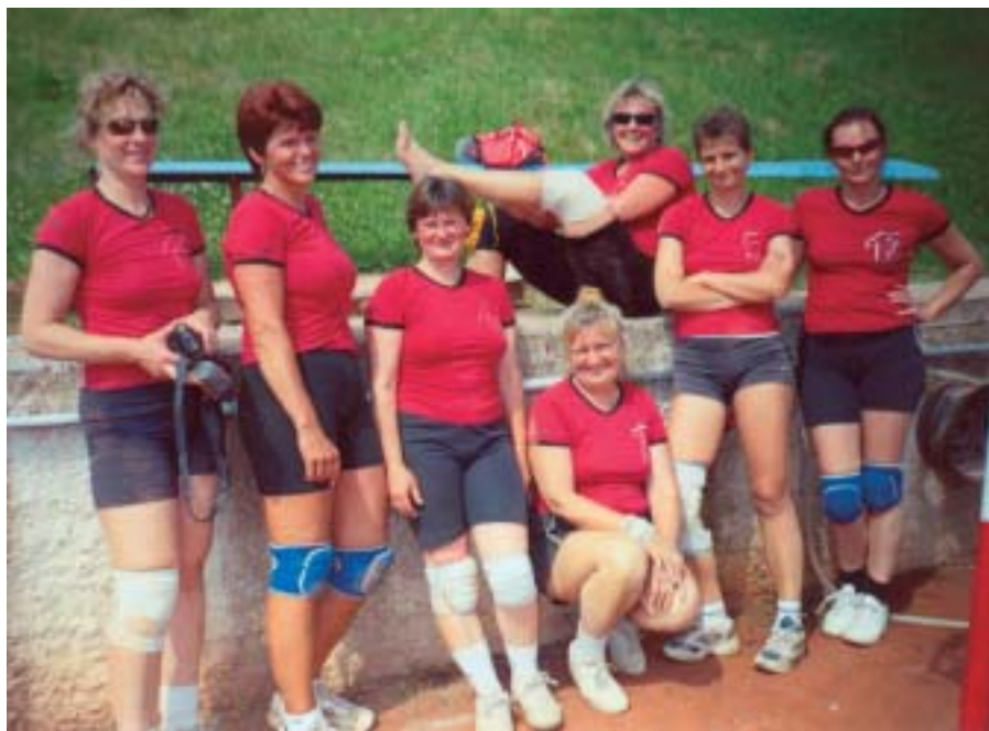
Volejbalové seniorky z Dobřichovic jsou sedmé v ČR

hou podávat dobré výkony a že svou úroveň mohou konkurovat i vyšším soutěžím. Je to dáno i tím, že v zúčastněných družstvech startují některé bývalé reprezentantky a extraligové hráčky.