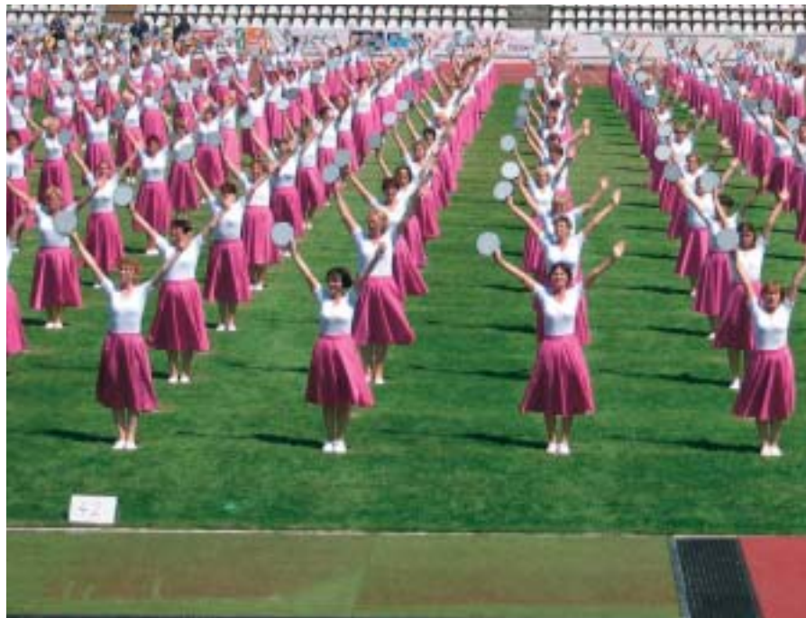
Dobřichovické Sokolky cvičily na Strahově v první řadě