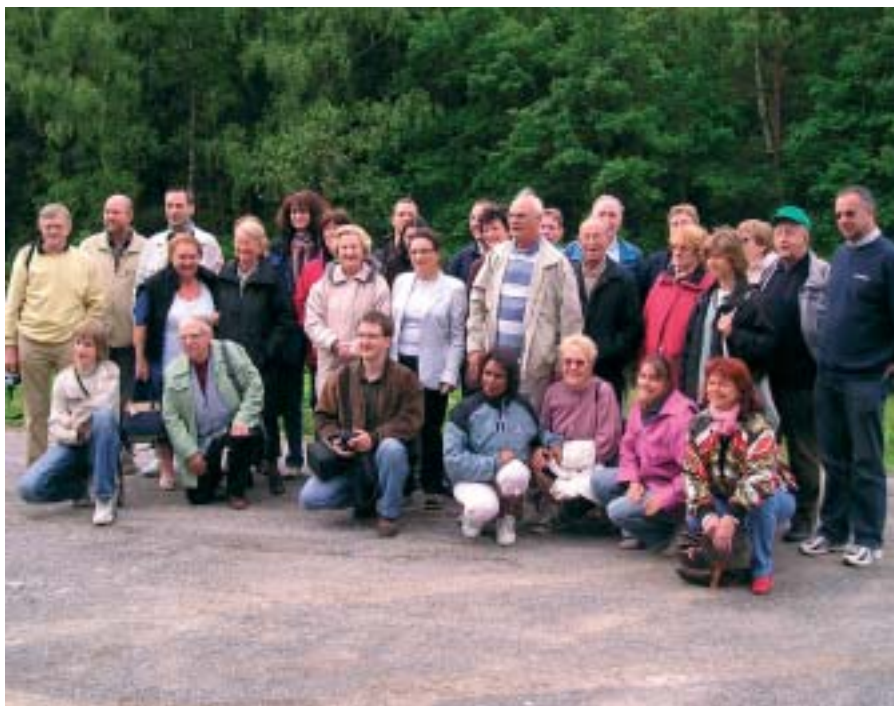
Třicetičlenná francouzská výprava z naší spřátelené obce Villieu Loyes Mollon