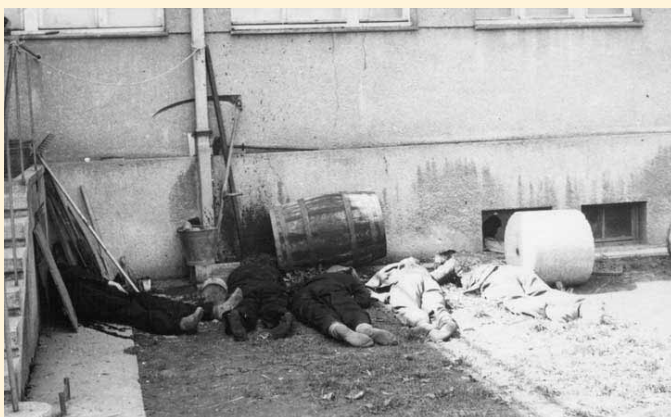
Zastřelení příslušníci SS v sokolovně.