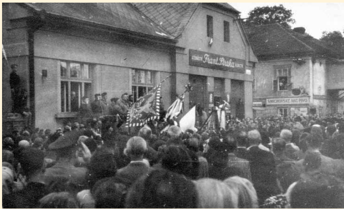
Vyzvednutí sokolských praporů z domu řezníka Straky. V pozadí je restaurace Stará pošta.