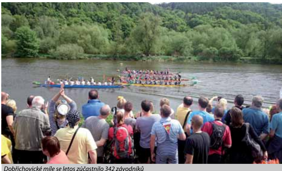
Dobříchovické míle se letos zúčastnilo 342 závodníků

zaci zázemí celého dne. Vždyť v několika rozjížděcích se podařilo posádkám srovnat na cílové foto-buňce do jedné vteřiny a v semifinálových a finálových jízdách dokonce do téměř půl vteřinového časového rozmezí. Byly to závody, jak by si každý přál. Bojovné, fandovské, regulérní ale přitom tvrdé a rozhodné. Jak se zdá, i do tohoto sportovního odvětví přichází nová krev, protože ani v jedné kategorii se nepodařilo loňským vítězům obhájit svá umístění. Loňský šampion v kategorii mix skončil na třetím místě, zatímco loňský účastník finále B se probojoval do letošního finále A, kde obsadil skvělé druhé místo. Ano přátelé, toto se povedlo teamu TORNÁDO FUTSAL DOBŘÍCHO-