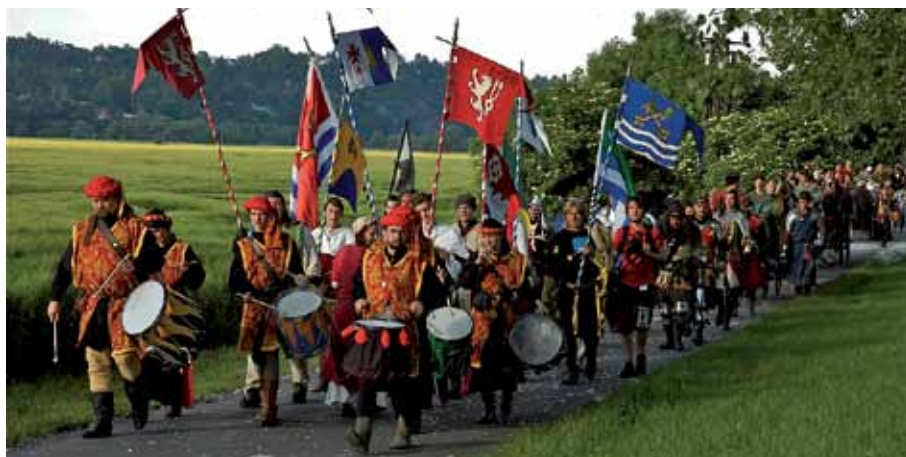
Loňský průvod procházel lukami podél Berounky

Karel Čtvrtý z Boží milosti císař Římský, vždy vznešený, a český král se svou chotí Alžbětou Pomořanskou, s rytíři, jezdci a dalšími příslušníky královského dvora vyjede ve vsi slávy v sobotu dne 6. června L. P. 2015 po 14 hodině z Radotína. Bude pak pokračovat přes Černošice a Mokropsy do Dobřichovic, kde stráví noc. V neděli 7. června po 10 hodině se průvod vydá z Dobřichovic přes