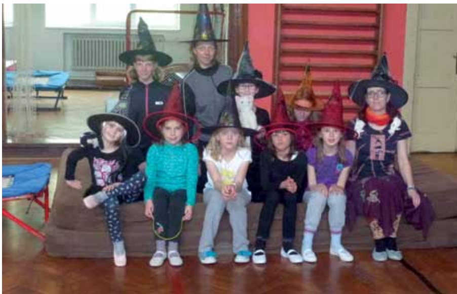
Čarodějnice přiletěly do sokolovny