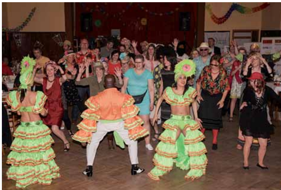
Ples Náruč v duchu Cubalibre

Počasi nás také podpořilo ve snaze zajistit skvělý den. Myslíme si, že letošní ročník opět nabyl na kvalitě jak sportovní, tak i profesionální organi-