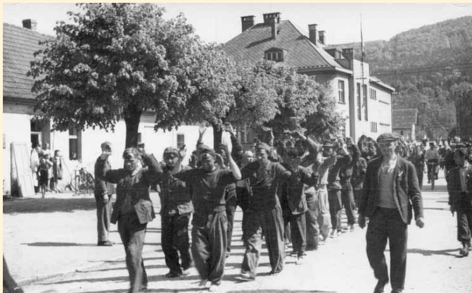
Zajatí příslušníci SS jsou ováděni do sokolovny.