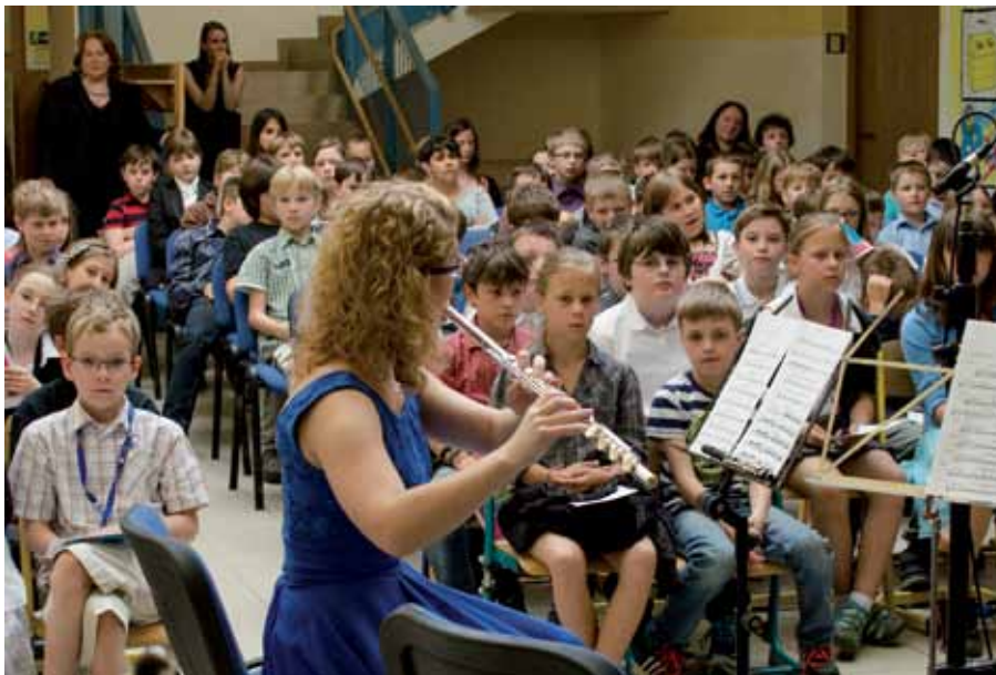
Koncert Dobřichovického hudebního jara

o finanční podporu, kterou společnost přednesla. Rada požádala před přijetím případného usnesení o doplnění informací o reference z jiných obcí.