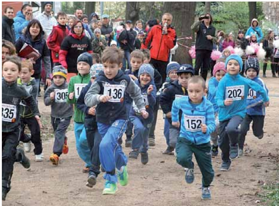
Dobřichovické míle se letos zúčastnilo 342 závodníků

Připomeňme si ještě, že naše ženské běhají které je v krajském přeboru druhé třídy zatím na šestém místě, bude hrát na domácím hřišti už jenom 17. května s Novým Strašecím, 30. května s Tuchlovicemi a 6. června s Komárovem B.