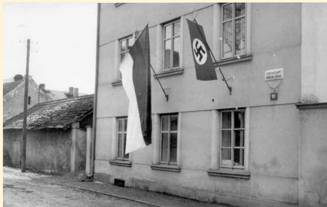
Protektorátní a německá vlajka na budově obecního úřadu.

Dobřichovice byly po celou dobu své existence ryze českou obcí. Obyvatelstvo mluvilo vždy česky jako svoji rodnou řečí. Všechny písemnosti, a to i hluboko v 19. století, byly psány vždy jen česky, např. i dekret z roku 1872, kterým císař a král (tehdy c. k.) František Josef I. „ ráčil nejmilostivěji Dobřichovice na městys povýšiti “ včetně dopisu smíchovského hejtmána, je psán česky. Nebyly tady žádné národnostní třenice, jak to bývalo zejména od poloviny 30. let v národnostně smíšených oblastech Čech a Moravy.