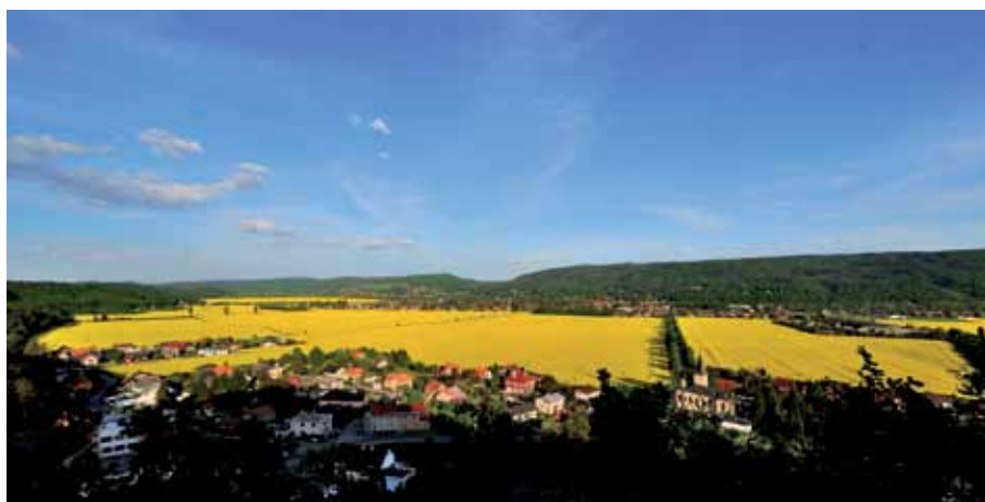
Kam až oko dohlédne, všude je řepka

Řepka je jeden ze základních biomateriálů, ze kterého se vyrábí biopaliva. EU svým členským státům uložila zajistit 10% podíl biopaliv v dopravě. Platnost tohoto opatření byla stanovena do konce roku 2015. Vzhledem k tomu, že ekologický přínos biopaliv je velmi malý, tak v současné době EU od podpory těchto biopaliv ustupuje a omezuje podíl biopaliv v dopravě z původních 10% na 5%. V rozporu s tímto trendem ale Andrej Babiš připravil zákon, kterým si jako Češi sami nakážeme držet původní 10%