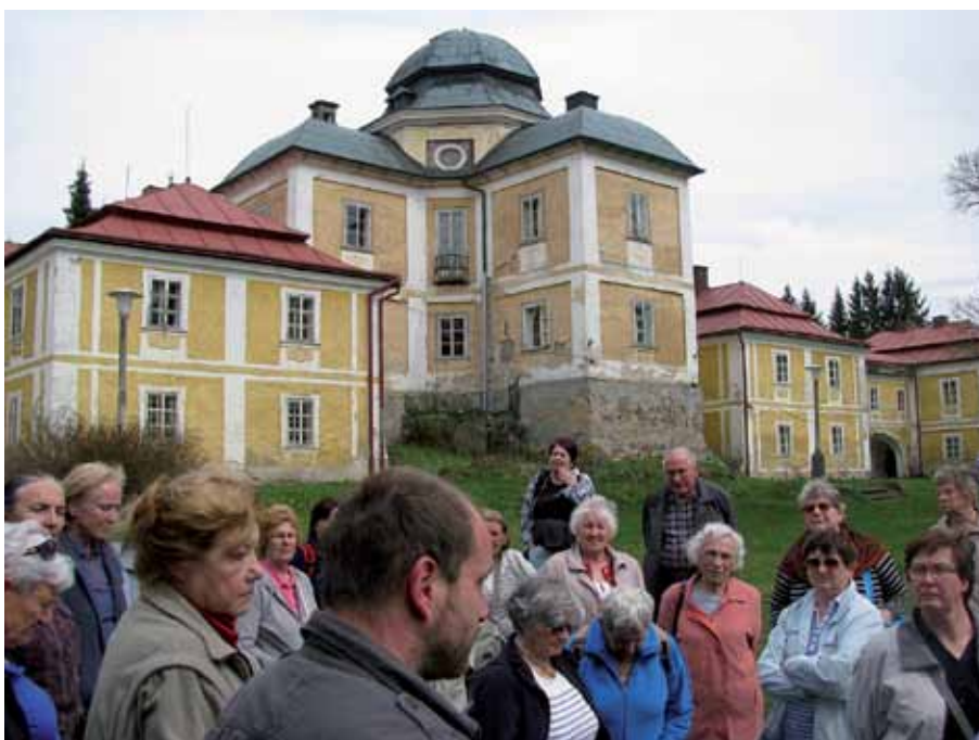
Povídání pana průvodce před chátrajícím loveckým zámkem Diana bylo poutavé