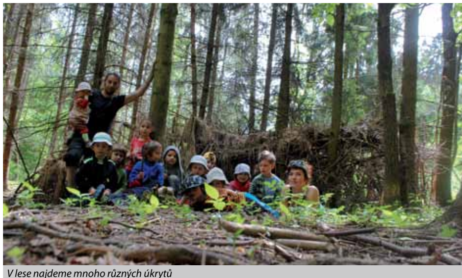
V lese najdeme mnoho různých úkrytů

Jednou v lese nás duben zastihl prudkým deštěm, který nás naučil čelit nepohodě, ale především ji sdílet. Jsme díky tomu houževnatější a máme k sobě zase o něco blíže.