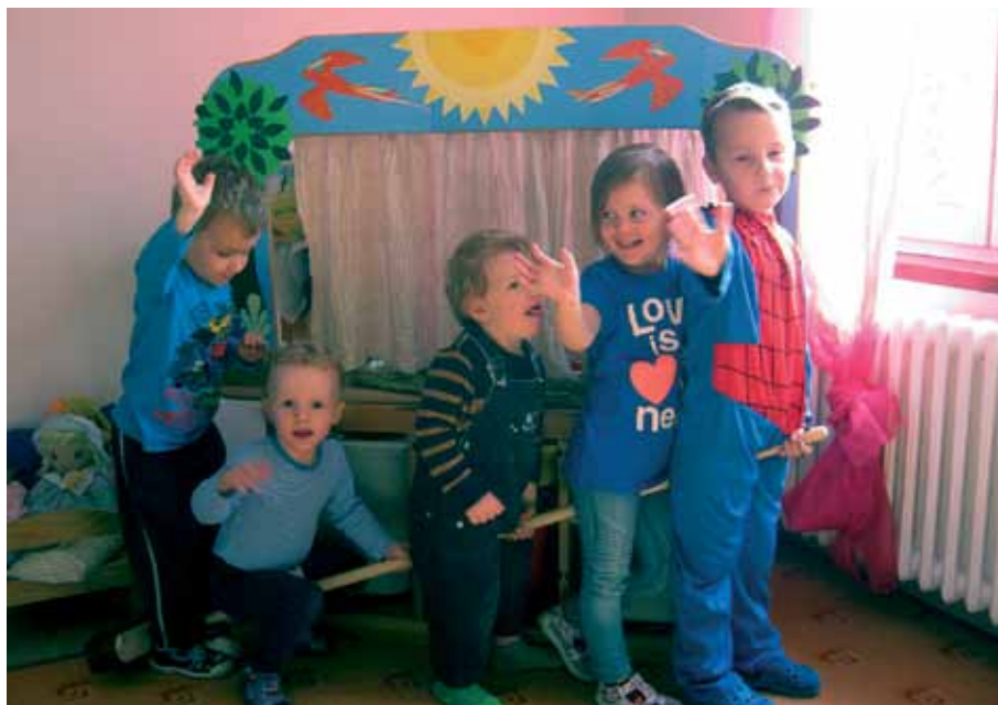
Děti ve školičce Lumek

Více informací naleznete na webu www.foovent.cz , www.vsechnychute.cz nebo na facebooku Všechny chutě světa www.facebook.com/vsechnychutesveta