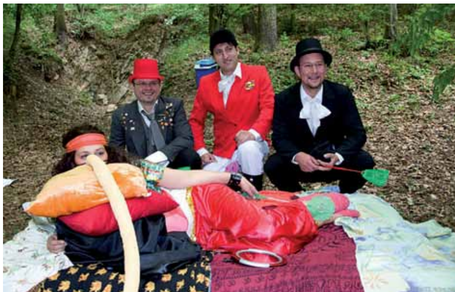
V pohádkovém lese nechyběli loni 3 veteráni s princeznou s dlouhým nosem

Loni si sebou Pandrhola do lesa přivedl i živé selátko a jeho hod na dálku jitničkami bavil