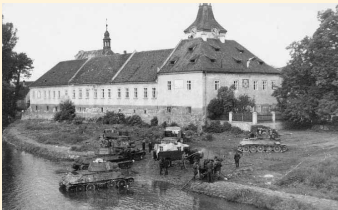
Tanky Rudé armády v květnu 1945 pod zámkem.

ním několikrát zakroužila, strojvůdce vlak zastavil, posádka vlaku i cestující z vlaku utekli a letadlo rozstřílelo kotel lokomotivy, která byla již dále nepoužitelná. To se stalo několikrát i na naší trati Beroun – Praha. Ve stanici Dobřichovice stál od 8. dubna maďarský vojenský transportní vlak, plně naložený tanky, děly a municí. Dne 19. dubna 1945 se zde odehrál velký útok anglických stíhaček a lehkých bombardérů. Bylo svrženo asi 20 trhavých bomb, nádraží však