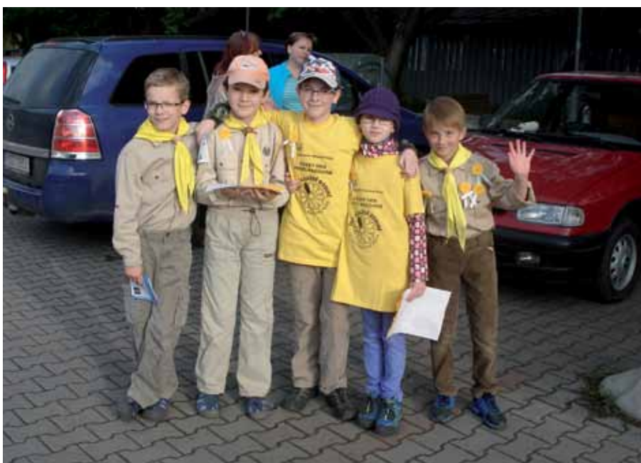
Dobřichovičtí skauti před nádražím.